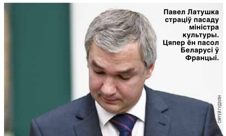
Павел Латушка страціў пасаду міністра культуры. Цяпер ён пасол Беларусі ў Францыі.