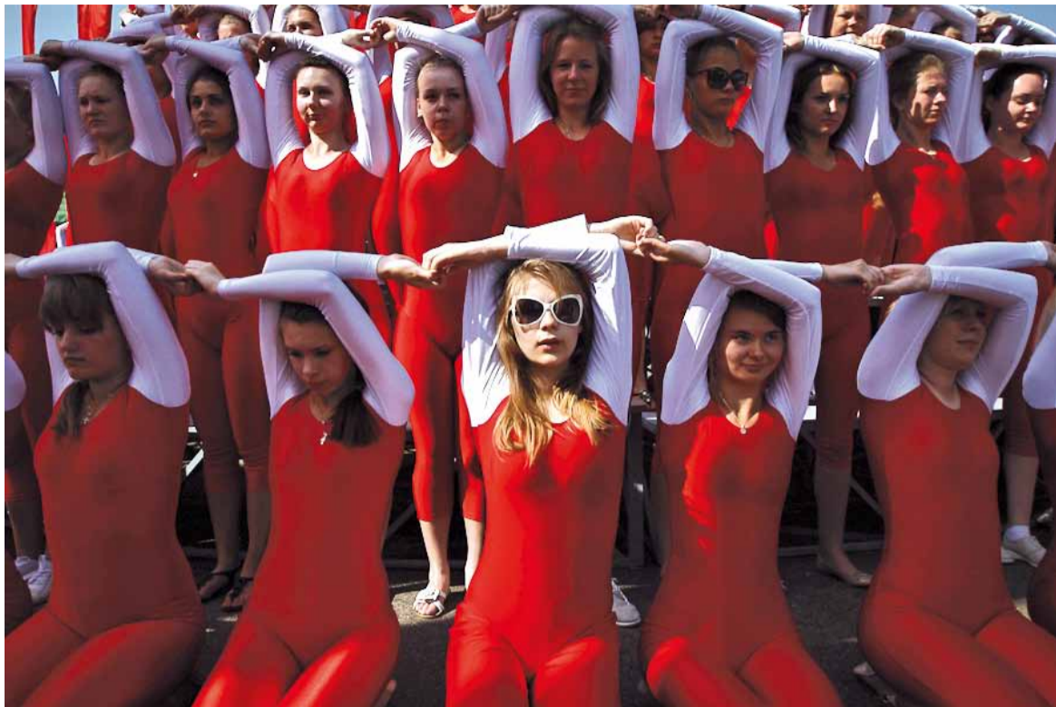
18 мне ўжо... За час кіравання Лукашэнкі вырасла цэлае пакаленне. На фота: парад 3 Ліпеня.