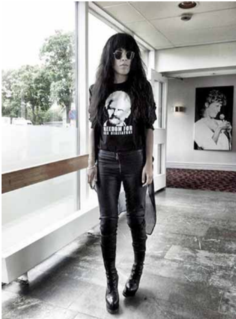
Ларын выказала салідарнасць з Алесем Бяляцкім.