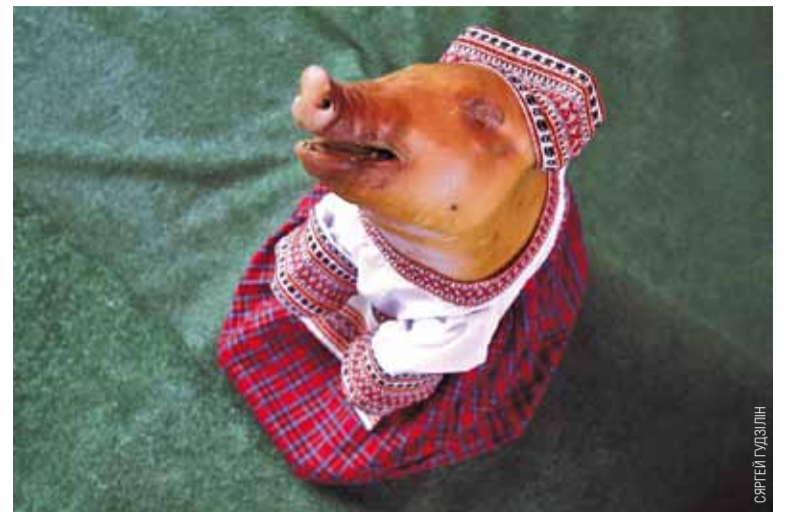
Трэшу на горацкіх «Дажынках» хапала.