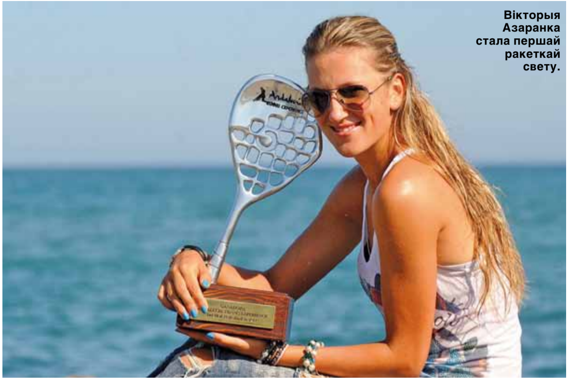
Вікторыя Азаранка стала першай ракеткай свету.

Спявачка такі паедзе на «Еўрабачанне». Хай і з другога разу. Першы адбор у лютым выліўся ў вялізны скандал з-за