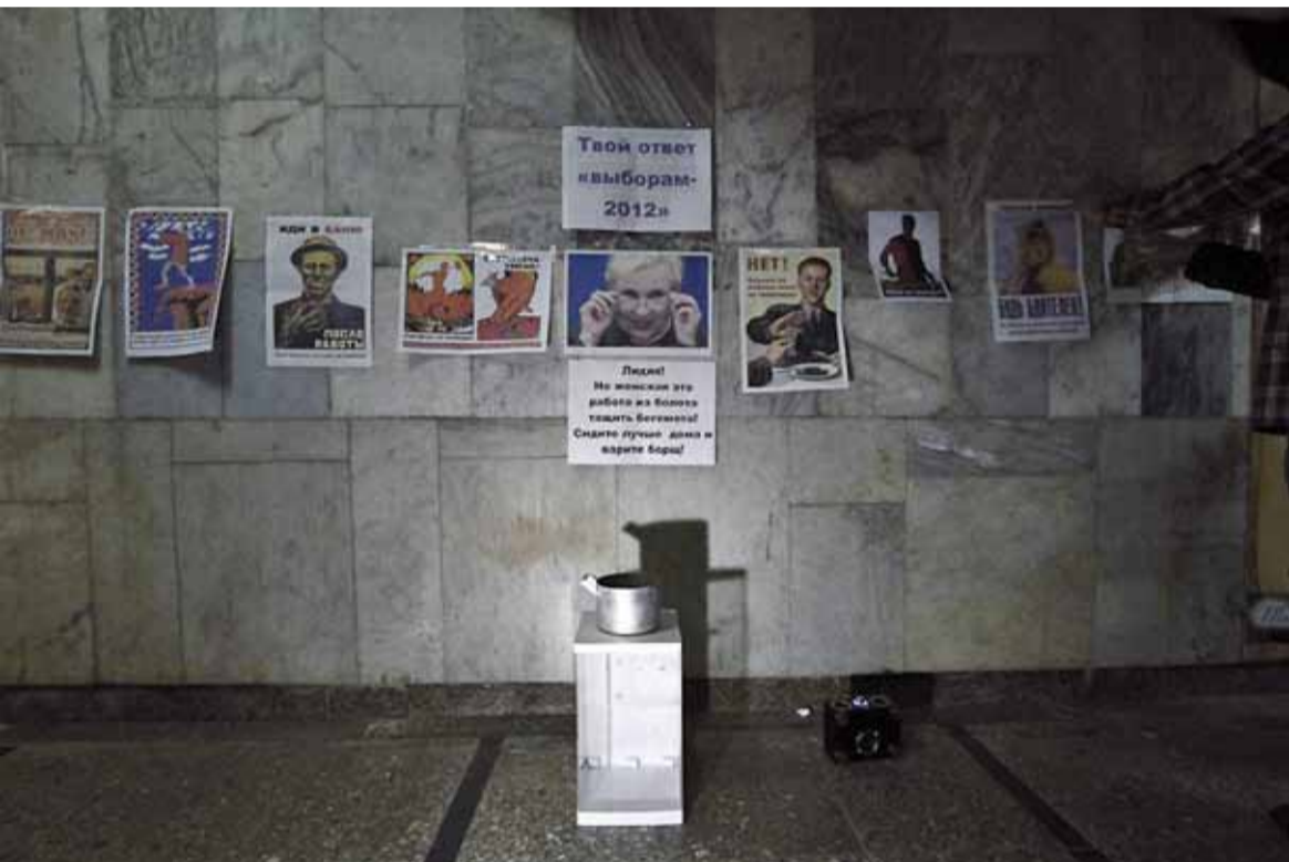
Парламенцкія выбары прайшлі паныла і без інтрыгі. У Беларусі сфармавалася чарговая стэрыльная палата прадстаўнікоў.