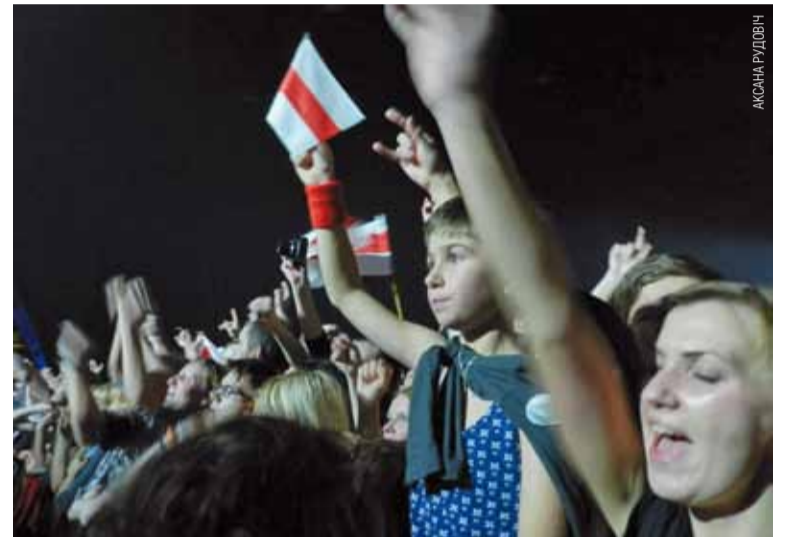
«Ляпіс Трубяцкой» цэлы год вымушаны быў даваць канцэрты за мяжой. Беларусы масава ездзілі на выступы ў Смаленск і Вільню.