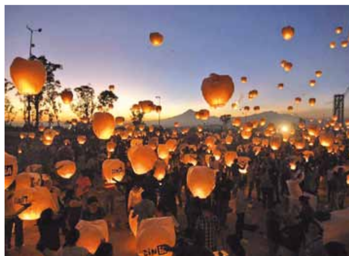
Мехіка. Людзі з абмежаванымі магчымасцямі запускаюць у паветра ліхтарыкі.