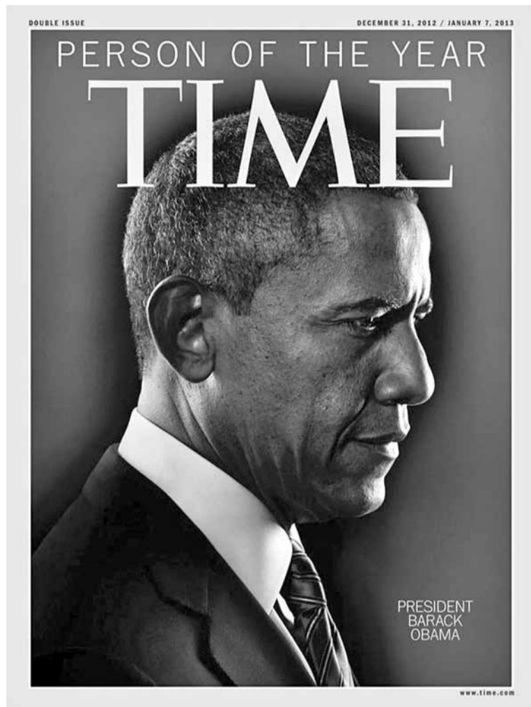
Часопіс Time другі раз назваў прэзідэнта ЗША Барака Абама чалавекам года.

На «Еўрабачанні» ў Баку перамагла шведская спявачка Ларын. У часе конкурсу яна сустрэлася з прадстаўнікамі азербайджанскай апазіцыі, а пазней