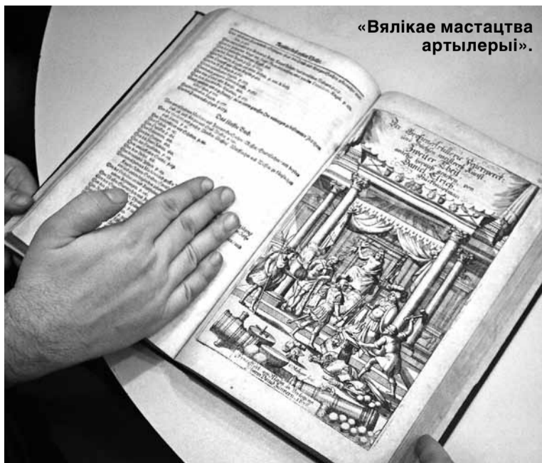
«Вялікае мастацтва артылерыі».