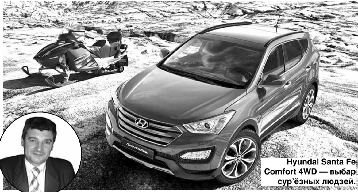
Hyundai Santa Fe Comfort 4WD — выбар сур'ёзных людзей.

Паводле афіцыйнай статыстыкі, Драгічынскі раён — адзін з самых бедных на Брэстчыне. Па ўзроўні заробкаў ён займае 13-е месца з 16 раёнаў. Горш толькі ў Століне, Маладэчынскім і Ганцавічах. Сярэдні ме-