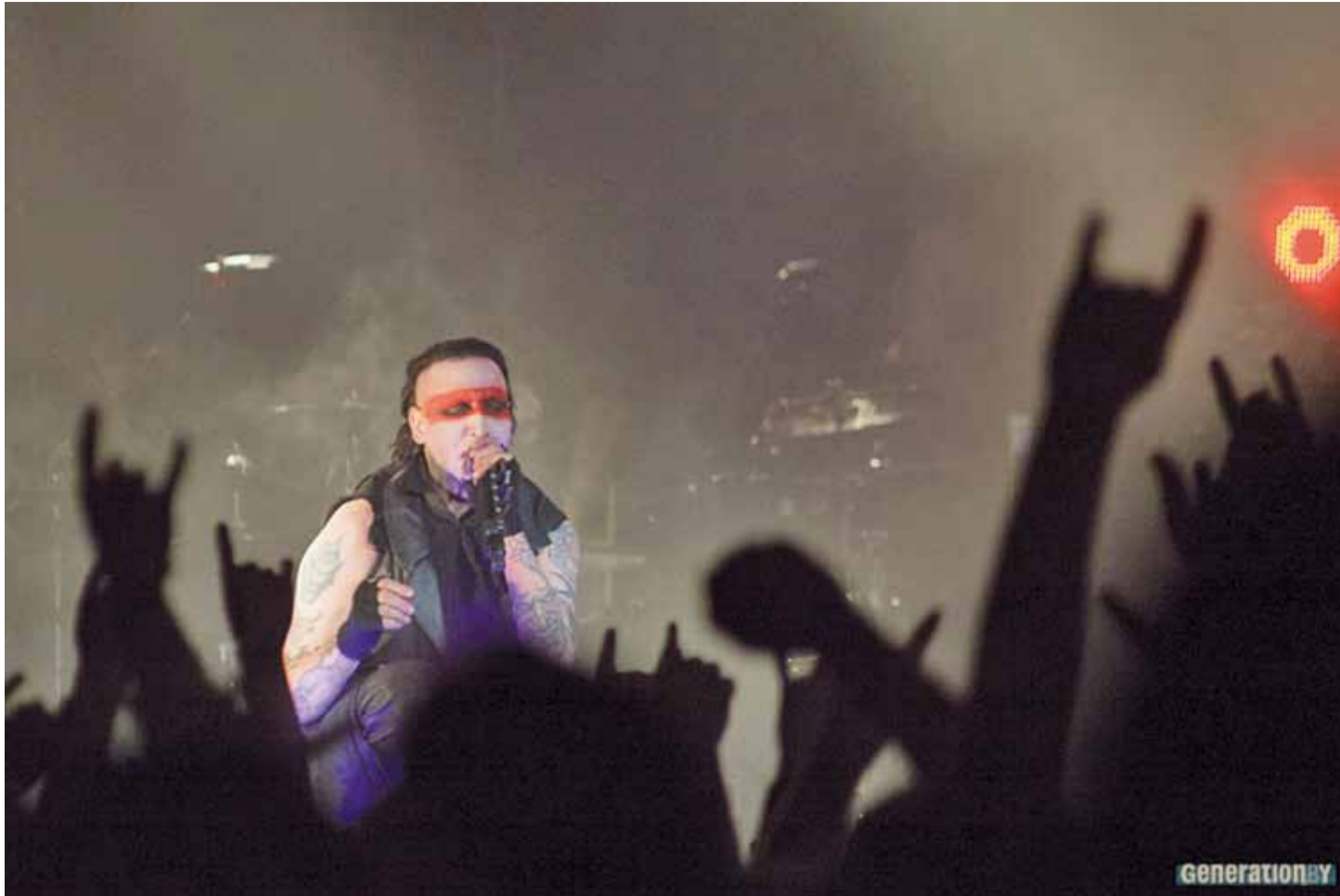
21 снежня ў мінскім Палацы спорту выступіў скандальны амерыканскі рокер Мэрылін Мэнсан. Цікава, што на сцэну ён выйшаў з бел-чырвона-белымі грамамі на твары.