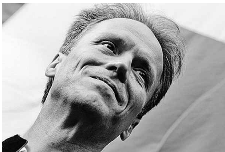
Пасол Эрыксан паляцеў, але абяцаў вярнуцца.