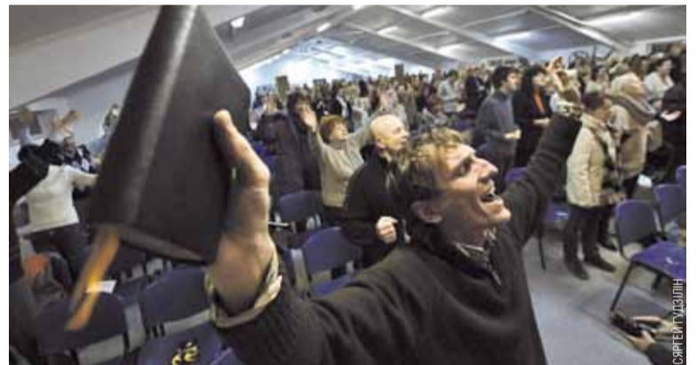
Вернікі пратэстанцкай царквы «Новае жыццё» адстаялі будынак, за які змагаліся шэсць гадоў.