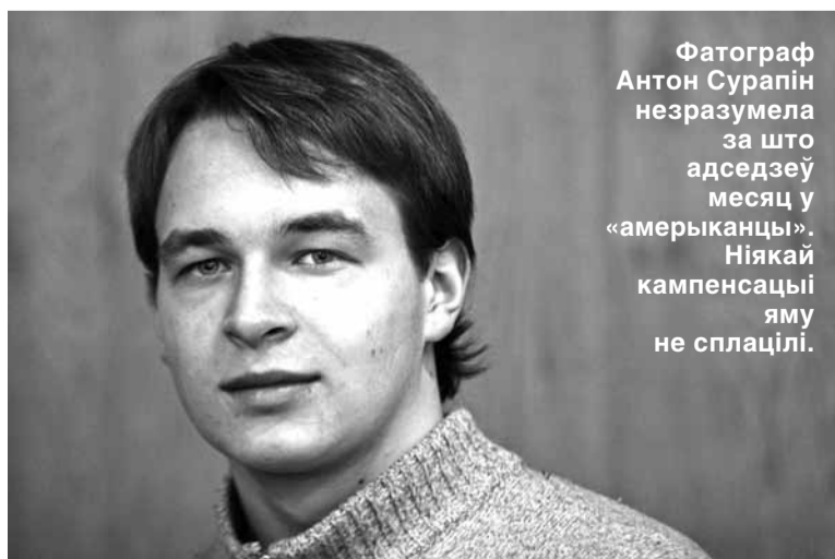
Фатограф Антон Сурапін незразумела за што адседзеў месяц у «амерыканцы». Ніякай кампенсацыі яму не сплалі.