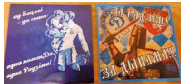
Стыкеры «Дынама» нагадваюць аб вернасці клубу.