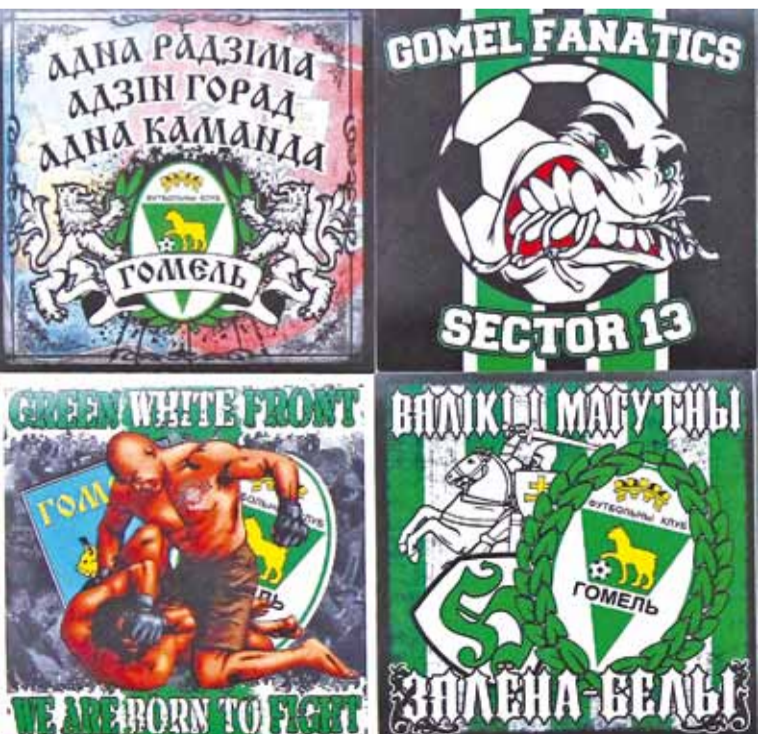
Большасць стыкераў робіцца за мяжой.