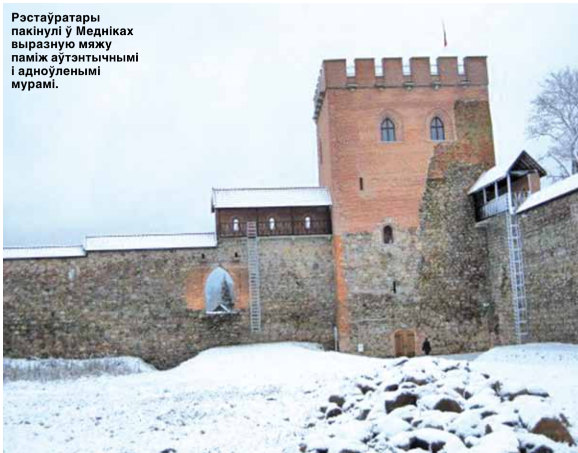
Рэстаўратары пакінулі ў Медніках выразную мяжу паміж аўтэнтчнымі і адноўленымі мурамі.

Замак даследавалі ад 1950-х і закансервавалі ў 1960-я. Рэкан-