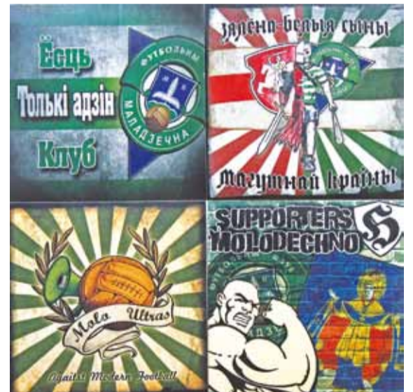
У фанат «Маладзечна» прыгожыя і якасныя стыкеры.