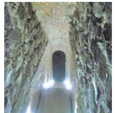
Лесвіца ў тоўшчы вежы — з кропкавай падсветкай...