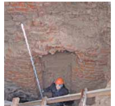
...Такую ж лесвіцу мы адкапалі ў Крэўскім замку.

грошай на яго ў разы меней. Што можна скарыстаць з медніцкага досведу? Ці ўдасца нашым архітэктарам утрымацца на тонкай мяжы мэдэрнізму і аўтэнткі?