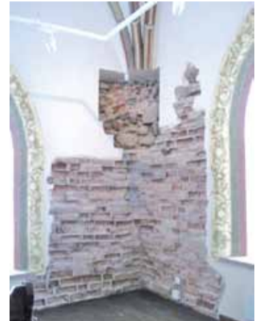
Пяты ярус вежы. Новая мураўка затынкаваная, каб падкрэсліць прыгажосць старої.

Знаёмства з вынікамі рэканструкцыі Медніцкага замка для нас важнае яшчэ і таму, што наперадзе — аднаўленне Крэва. І