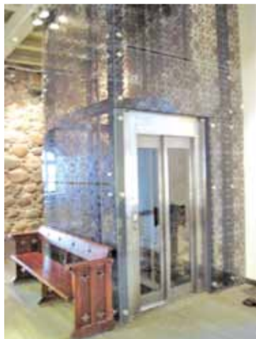
Ягайлу і не снілася: шкляны ліфт і бетонныя бэлькі ў вежы Медніцкага замка.

Адноўлены не ўвесь замак. Рэканструяваная толькі вежа-данжон і сцены абалі. Іншыя муры проста пакрытыя дахоўкай.