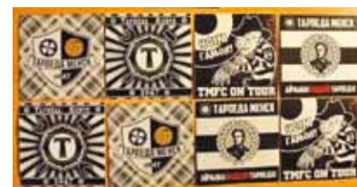
На тарпедаўскіх налепках не толькі Каліноўскі, але і Фрэдзі Кругер.