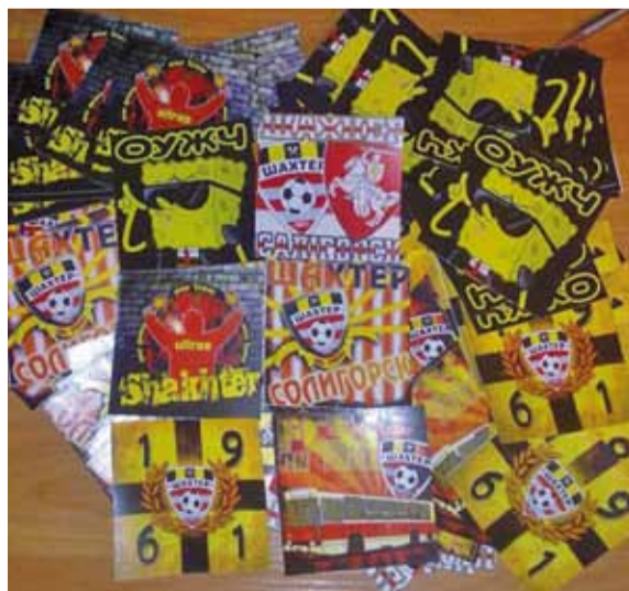
Пагоню шануюць большасць «хуліганаў».