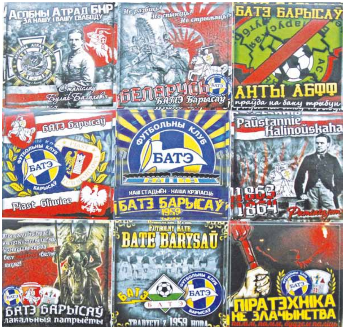
На стыкерах БАТЭ — Каліноўскі і Булак-Балаховіч.