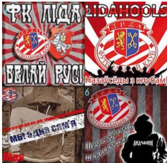
Меншыя клубы падцягваюцца за большымі.