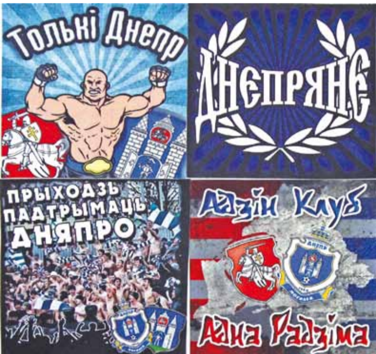
Магілёўцы робяць налепкі не толькі белмоўныя, але і ў стылі «славяне».