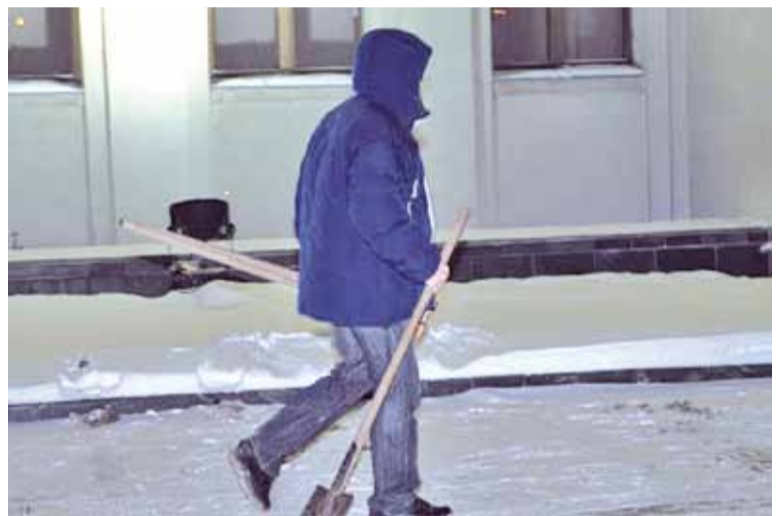
Біццё шкла ў ДOME ўрада распачалі нікому не вядомыя тыпы. Яны ж падносілі рыдлёўкі аднекуль збоку. Пасля да іх далучылася і частка гарачых галоўаў з шэрагаў сапраўдных дэманстрантаў. Чалавека з рыдлёўкамі, зафіксаванага на гэтым фотаздымку і відэа, так і не знайшлі.