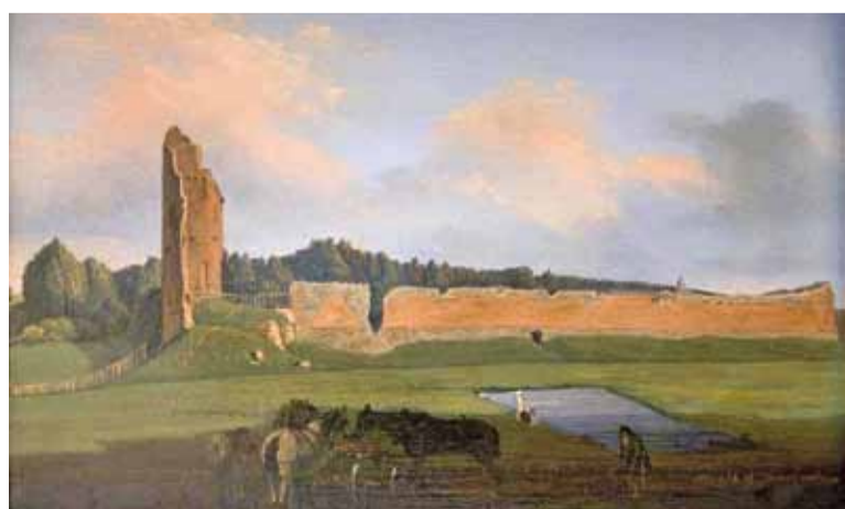
Так выглядаў замак 150 гадоў таму. Вінцэнт Дмахоўскі. Руіны замка ў Медніках (1853).

Беларускія рэстаўратары плануюць ісці ў Крэве процілеглым шляхам: максімальна дакладна захаваць архітэктурна-вобразныя рашэнні даўніх дойдлаў, фактычна, абдуоўваць Княскую вежу такой, якой яе бачыў Кейстут. Будзем спадзявацца, што мэты нашых архітэктараў удасца рэалізаваць.