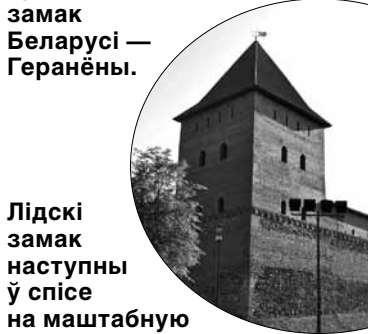
Лідскі замак наступны ў спісе на маштабную рэканструкцыю.