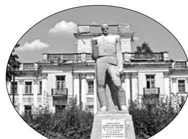
Перад палацам у Жамыслаўлі стаіць безгустоўны вайсковы помнік.