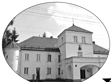
Цішыня каля дома-крэпасці ў Гайціонішках наводзіць жах на турыстаў.

Ці стане хата, дзе нарадзіўся Зянон, музеем?