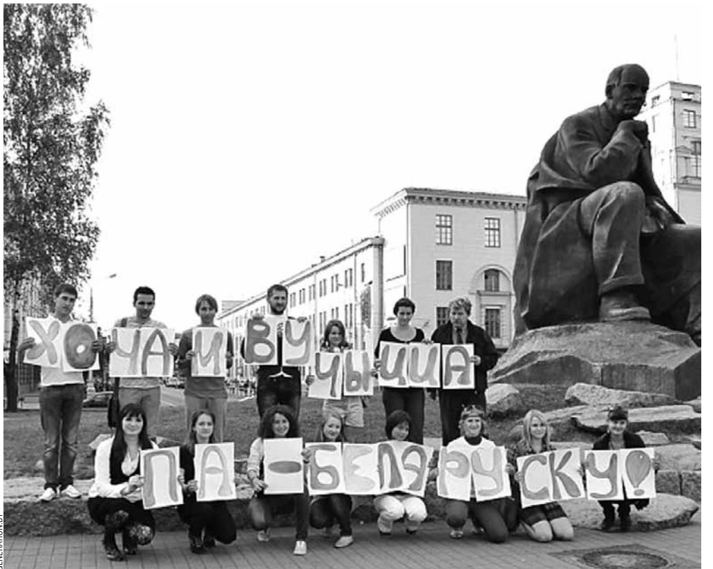
Мінскія студэнты патрабуюць навучання па-беларуску. Акцыя прайшла 3 верасня на плошчы Якуба Коласа.