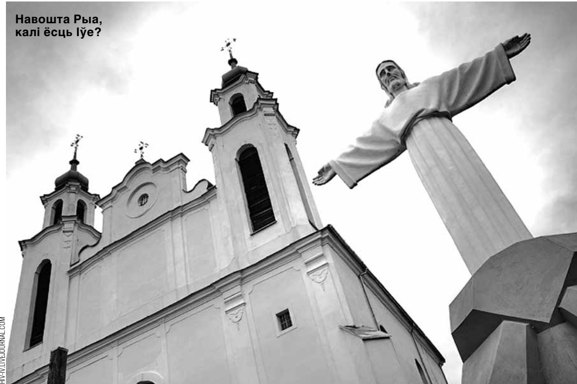
Навошта Рыа, калі ёсць Іўе?

га знаходзіцца магільны склеп Умястоўскіх. Другая славатасць — родная хата Зянона Пазняка. Кажуць, раней у шэрагах БНФ была ледзь не палова местачкоўцаў. Дзе знаходзіцца хата, пакажа любы мясцовы жыхар. Шлях проты — за касцёлам павярнуць направа, праехаўшы масток, зноў звярнуць направа перад прыватнай крамай і праехаць проста каля 100 метраў. Хату можна пазнаць па вялікім крыжы перад ёй. У хаце не жыве ніхто, ды і патрапіць усярэдзіну наўрад ці ўдасца. Пас-