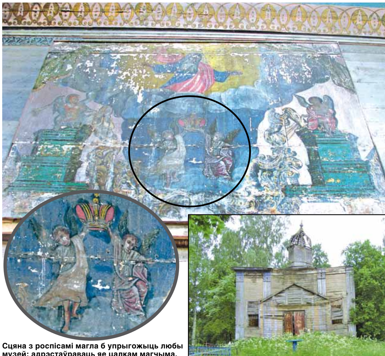
Сцяна з роспісамі магла б упрыгожыць любы музей: адрэстаўраваць яе цалкам магчыма.