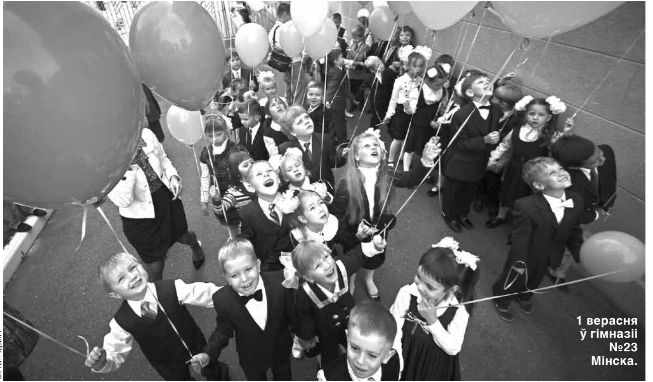
1 верасня ў гімназіі №23 Мінска.