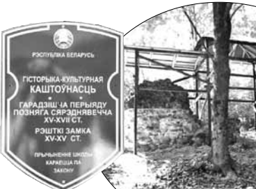
Самы сумны замак Беларусі — Геранёны.