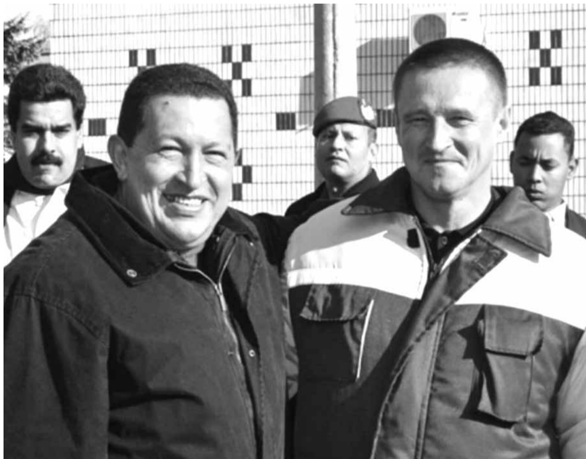
На «Дзяржынскі» возяць замежныя дэлегацыі. Леанід Заяц (справа) і прэзідэнт Венесуэлы Уга Чавес.

Мінск, які з'яўляецца для «Дзяржынскага» галоўным рынкам збыту, быў гатовы «праглынуць» ледзь не любы аб'ём курыц-бройлераў. Каб задаволіць попыт, летась забой птушкі быў павялічаны ўдвая, да 80 тысяч штук у дзень.