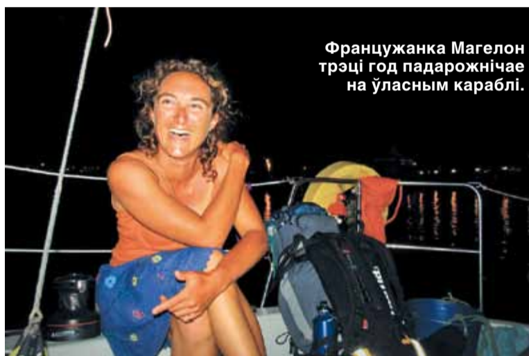
Французжанка Магелон трэці год падарожнічае на ўласным караблі.