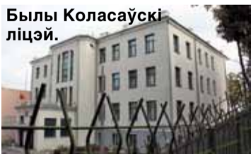
Былы Коласаўскі ліцэй.

Легендарная ўстанова працягвае дзейнасць. Дзеці вучацца па беларускіх і польскіх праграмах адначасова і атрымліваюць польскія атэстаты як беларускамоўны ліцэй у горадзе Гданьску. Навучанне вядзецца цалкам па-беларуску. Сярод педагогаў — многія легендарныя асобы. А само навучанне мае флёр выкліку існаму ладу. Падбор дзяцей — выдатны.