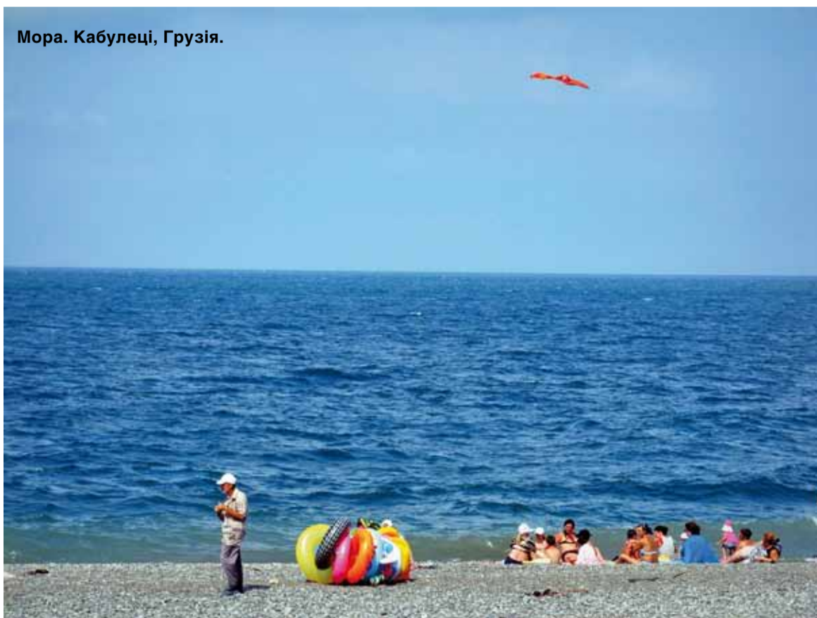
Мора. Кабулеці, Грузія.