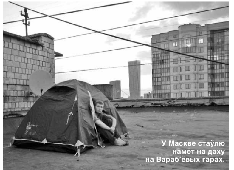
У Маскве стаўлю намёт на даху на Вараб'ёвых гарах.

Выходжу на цэнтральную плошчу «Гэй! Ты куды? — кліча мяне незнаёмы мужчына. — Да Тбілісі ехаць зранку паездзеш». У памяці ўзнікае «паехалі ў Нальчык, замуцім утраіх»,