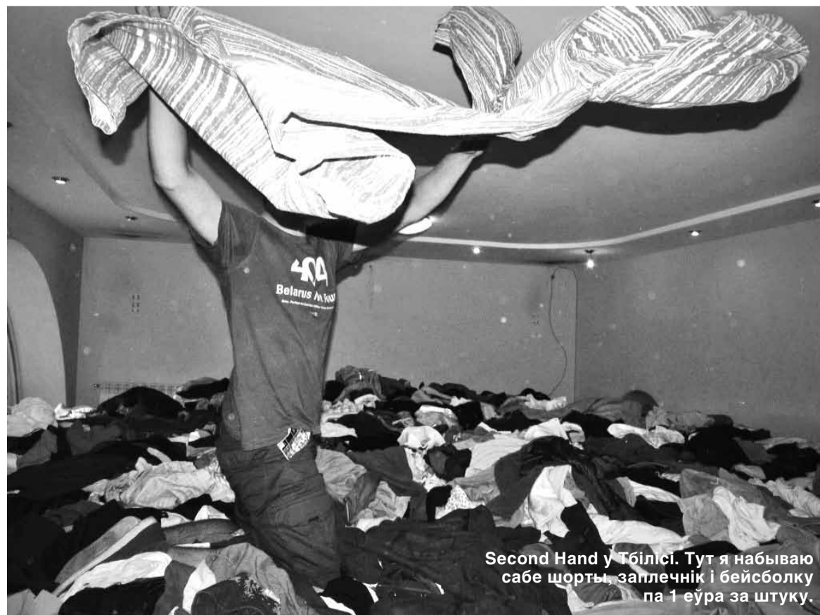
Second Hand у Тбілісі. Тут я набываю сабе шорты, заплечнік і бейсболку па 1 еўра за штуку.

таму адмаўляюся. Я ў Грузіі першую гадзіну і яшчэ не ведаю, што гасціннасць тут цалкам натуральная.