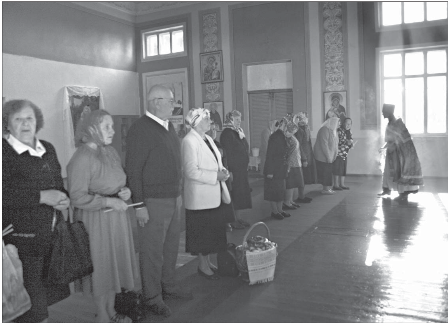
Яблычны Спас у Ветрыне на Полаччыне. У савецкі час царква была перароблена ў клуб.