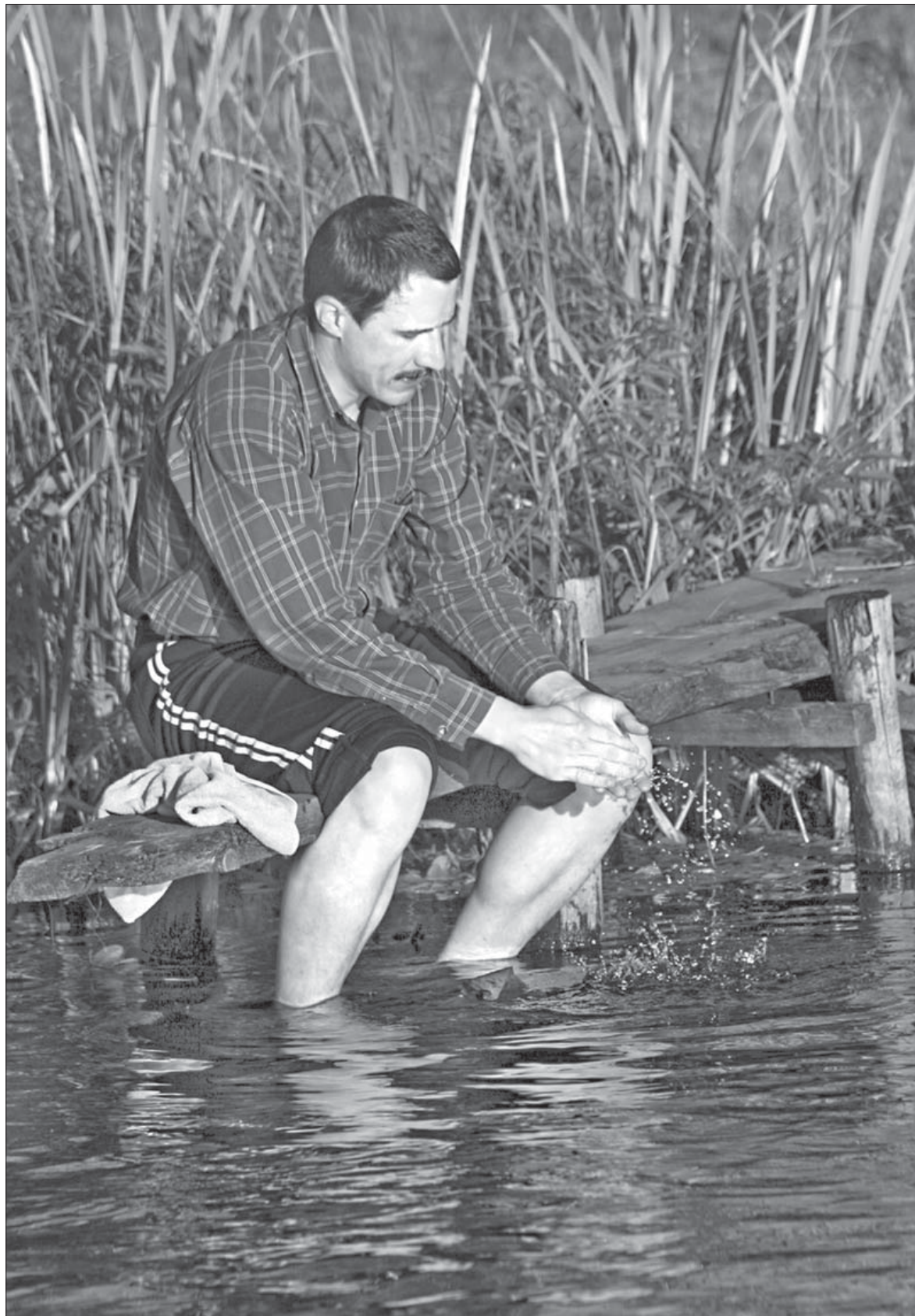
Мыцца можна ў лазні раз на тыдзень. На астатнія дні ёсьць рэчка Палата.