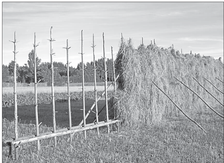
Сітнянцы сушаць сена на азёрадах.

працуе з дрэвам беларус. Цяпер раблю гэта сам. Урэшце, Ісус Хрыстос да трыццаці гадоў таксама працаваў з дрэвам».