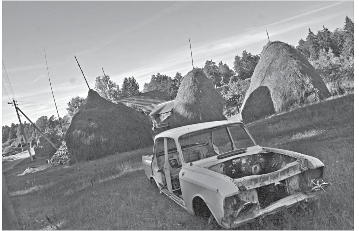
У радыёсе 30 кілямэтраў ад Сітна ніводнай царквы і ніводнага газэтнага шапіка.

Менавіта так, з малой літары. Бо гэта не чалавек, а тэхнічны сьпірт-шклоачышчальнік. Яго возіць сюды з Расеі ды прадаюць зь цягніка. Натуральна, шкло «максікам» тут ніхто ня чысьціць. Спачатку людзі нават ня ведалі, якую атруту п'юць, бо сьпірт прывозілі бяз цэтлікаў. Толькі калі «максімка» выправіў пару аматараў на той сьвет, цэтлік прывезьлі. Але і ведаючы ўсю праўду, многія не адракаюцца ад найлепшага сябра — надта ж ужо выгадна: пяць літраў — дваццаць тысяч. «Гэта вы ня ў