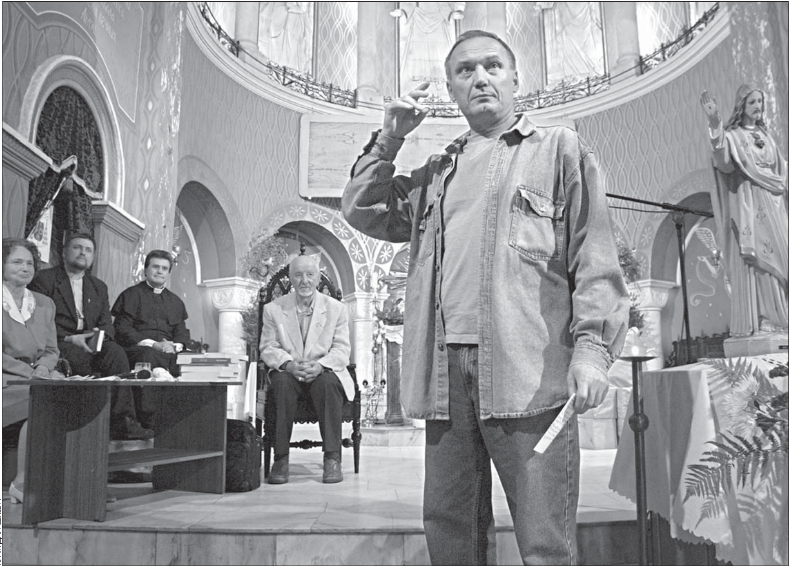
Уладзімер Някляеў: «Народы б'юцца за волю. А вас у волю не ўпіхнуць...»

даваў для таго самага — каб стаць загадчыкам адзелу, галоўным рэдактарам, ляўрэатам, ардэнаносцам, і гэтак далей, і далей, і чорт яшчэ ведае, для чаго.