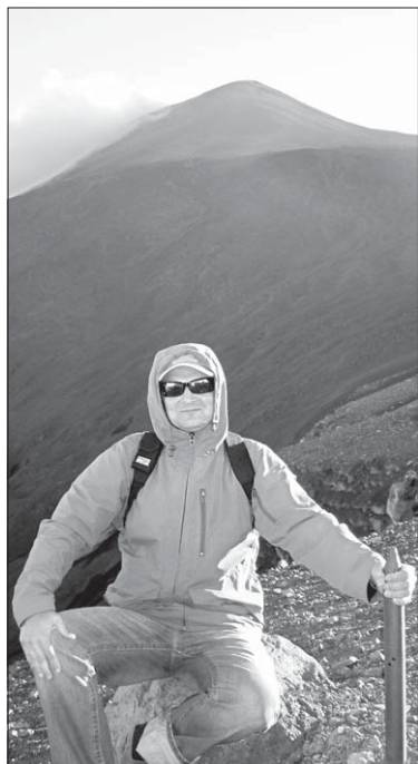
У роспале лета на вяршыні Этны морозна.

ся пад вадою, утвараючы такім чынам Сыцылію. За вядомую нам гісторыю адбылося каля 135 вялікіх выбухаў. Гісторык Фукідыд пісаў, што ў V ст. выкіды магмы засыпалі горад Катанія, што за 20 км ад вулькана.