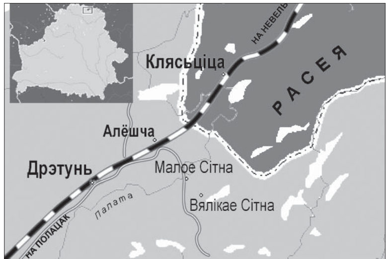
Аўтобус з Полацку (рэйсы на Труды, Уладзімераўку) прыбывае ў Малое Сітна ў 7.53. Адпраўляецца зь Сітна увечары ў 17.40 (панядзелак), 18.20 (серада, пятніца, субота, нядзеля). Павал вызваляецца з працы пасья 16.00. Паездка можа акупіцца за кошт збору грыбоў ці брусніцаў, якіх у навакольных лясох безь меры.

Паказальнае адрозьненне ад заходнебеларускіх вёсак: прыватных крамаў ні ў Алёшчы, ні ў Сітне няма. Навошта? І ў дзяржаўных асартымэнт «нармальны для сельскай мясцовасьці»: сыроў адзін від — сулугуні; марозіва адзін від — марозіва; тушаніна ёсьць. З прысмакаў —