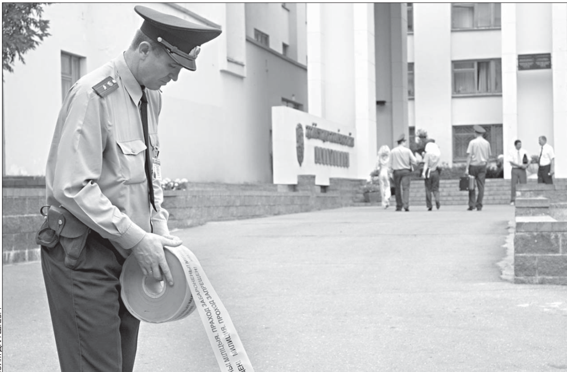
Так званая «Беларуская народна-вызвольная армія» у пятніцу распаўсюдзіла паведамленне аб замініраванні выканкамаў Маскоўскага, Фрунзэнскага, Ленінскага і Партызанскага раёнаў Менску, філіялу 0101 «Прыёрбанку» на вуліцы Ціміразева і некаторых участкаў чыгуначных шляхоў. Выбуховы прыстасаванні міліцыя ня выявіла. Заведзена крымінальная справа. Між тым, знайсці кампутар, з якога быў адпраўлены ліст, можна праз IP-адрас, які мае кожная машына.

Неймаверным чынам гэтая абстракцыя атрымала новае ўвасабленне ў дачыненні да сучаснай Эўропы. У эўрапейскай Канстытуцыі, забракаванай на рэфэрэндумах у Францыі ды Нідэрляндах, няма згадак пра новую гістарычную супольнасць, як няма й азначэння эўрапейскасці. Але ж спробы ўвесці ў прэамбулу Канстытуцыі згадку аб хрысціянскай культуры былі і напэўна яшчэ будуць. Галоўнае ж заключаецца ў спробе ства-