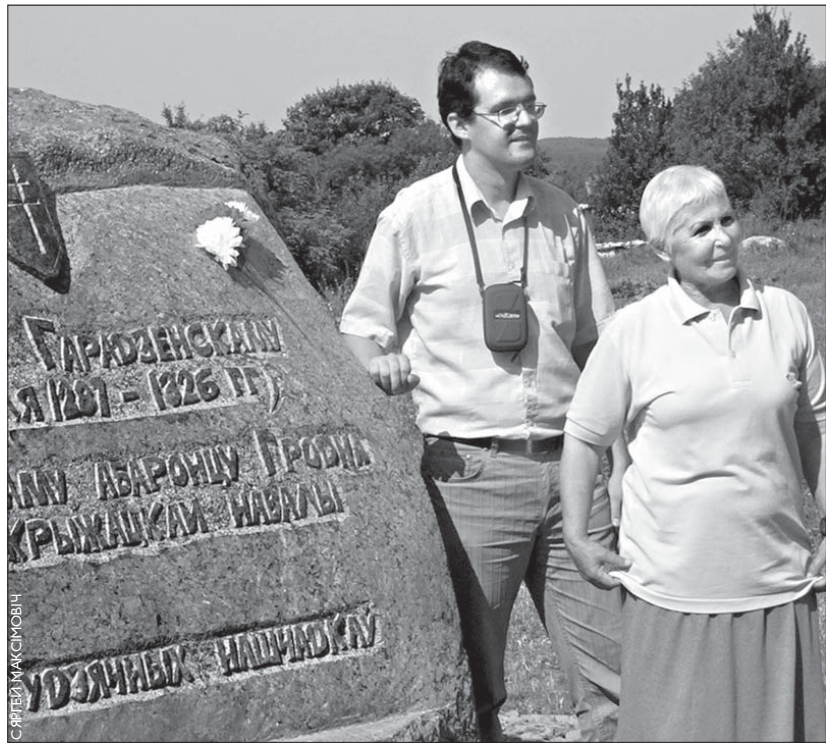
Камень-помнік Давыду Гарадзенскаму.

У Горадні за мурам, які атачае Каложу, укапаны ў зямлю камень. На ім — мэталічная дошка з гербам ВКЛ ды надпісам «Пагоня на Грунвальд. 1410». Дзесяць гадоў таму з грунвальдзкага помніка скралі бронзавую шыльду. Сёння яна са звычайнага мэтала, серабрыста-шэрая. Піша Сяргей Максімовіч .