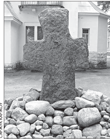
Крыж цяпер стаіць каля старога панскага маёнтку ў вёсцы Межава.

Надышла другая ноч супрацьстаяння паміж межаўскім сьвятаром ды азяркоўскімі людзьмі. Гэтым разам, каб прадухіліць вываз крыжа ноччу, мужыкі паставілі ахову. Зь сякерамі ды віламі па чарзе яны правялі ля помніка ўсю ноч. Ні ноччу, ні днём сьвятар не зьяўляўся, але людзі працягвалі стаяць каля крыжа. Толькі на трэцюю ноч іх зьмянілі міліцыянты. Раніцай усе даведаліся, што ў дачыненні да сьвятара заводзіць крымінальную справу за спробу скрасьці гісторыка-культурную каштоўнасьць. Людзі вырашылі, што гэта перамога, і на тым вярнуліся да сваіх звычайных спраў.