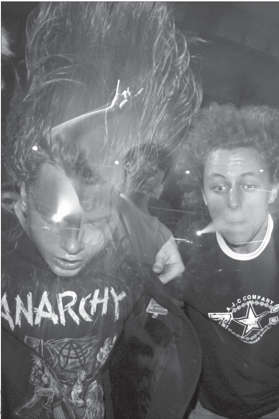
Моладзь танчыць пад «Partyzone» у клубе «Рэактар».

Цяпер са зьменай іміджу, музыкі, складу іх пачалі параўноўваць з «Рэйнбоў». Яўген ставіцца да гэтага стрымана: «Ня варта рабіць з музыкі спорт і параўноўваць розных музыкаў. Кожны творчы парыў варта існаваньня. Калі твор нарадзіўся, значыць, ён камусьці патрэбны».