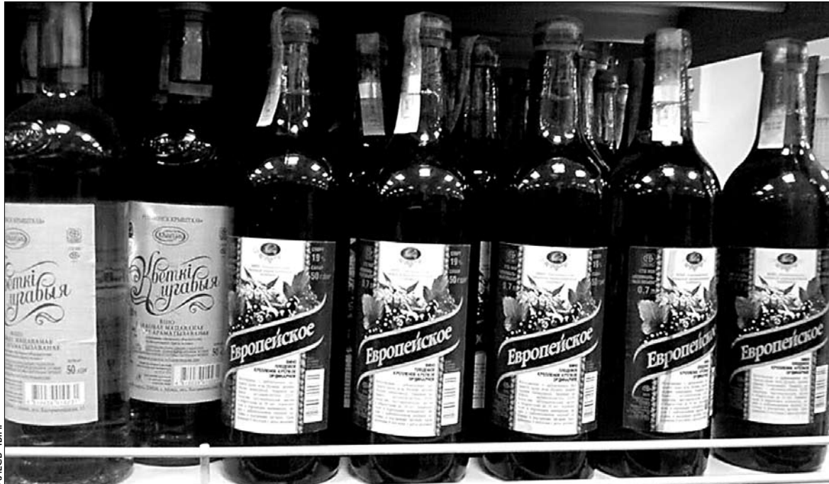
Новыя павевы ў аналогіі: разам з паваротам краіны на Запад на прылаўках з'явілася плодова-ягаднае «Еўрапейскае» віно.

Некалькі гадоў таму ў Беларусі спрабавалі рабіць гарэлку «Ша-