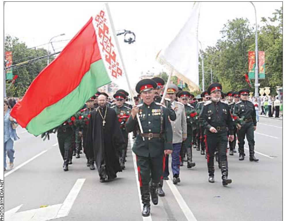
«Беларускія казакі» — арганізацыя, сфармаваная на ўзор расійскага казацтва.