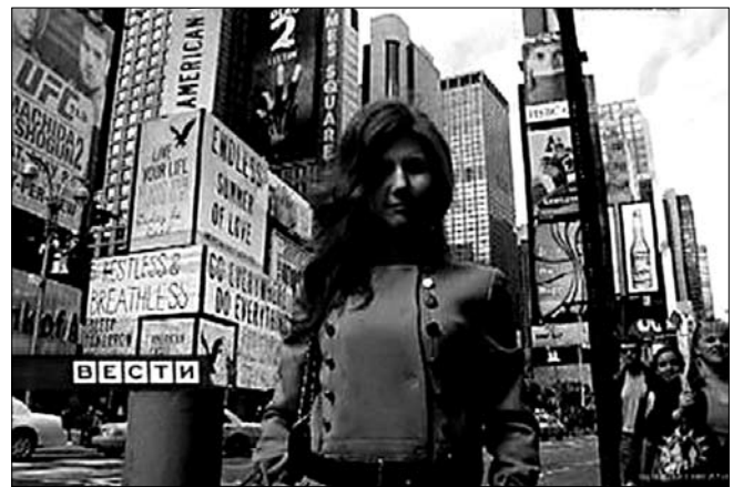
Былы муж-англічанін расійскай агенткі Эн Чэпмэн (сапраўднае імя невядомае) раскрыў шмат падрабязнасцяў інтымнага жыцця шпіёнкі.