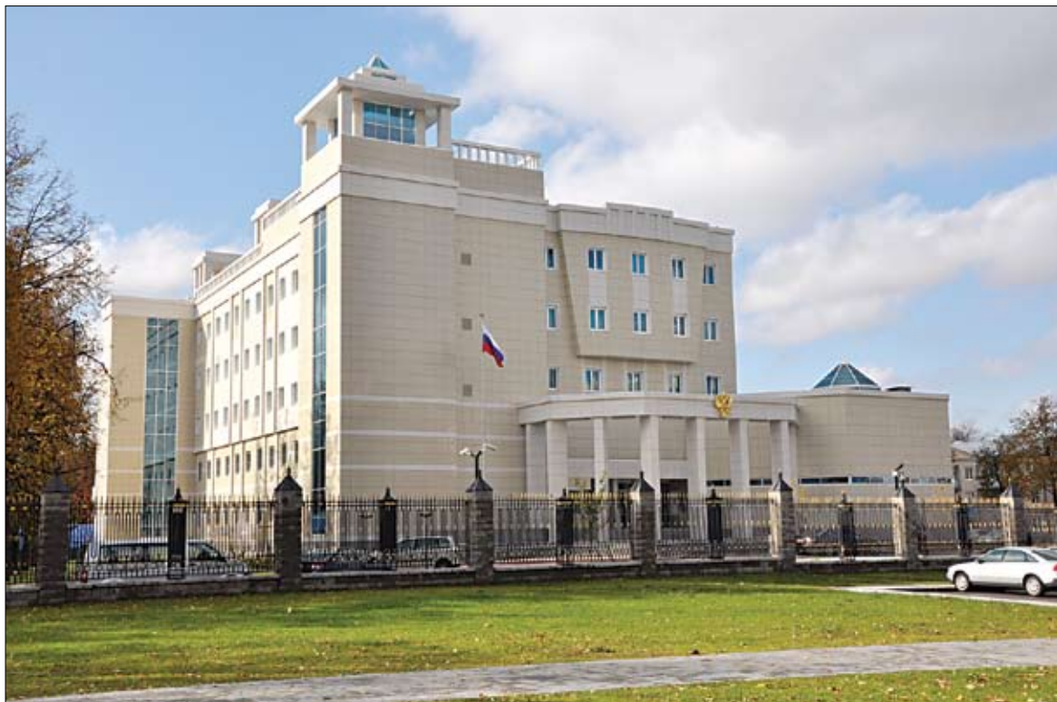
Аграмадзіна новага пасольства Расіі ў Мінску.

ўзгадаць і пра ідэалагічныя рычагі «Газпрома». Тэлекампанія НТВ, а значыць, у прыватнасці, і «Хросны Бацька» — справа газпрамаўскіх рук.