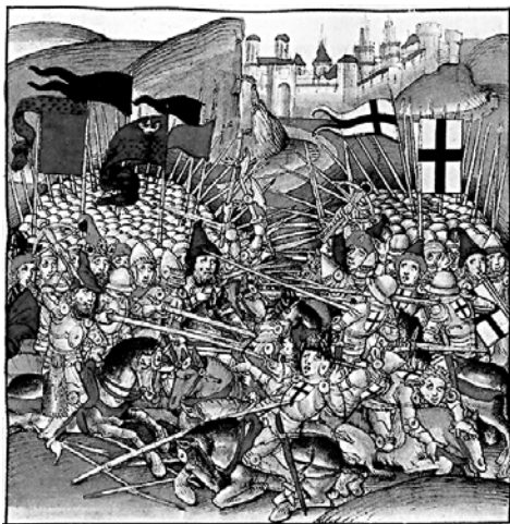
Адна з першых выяваў Грунвальдскай бітвы: мініяцюра са швейцарскай ілюстраванай хронікі Luzerner Schilling (1515).

Акрамя каронных і вялікакняскіх сіл ды татароў у склад арміі саюзнікаў уваходзілі малдаўскія і сербскія аддзелы. Агулам войска падпарадкоўвалася Ягайлу, аднак на справе каардынаваць і кантраляваць такую колькасць людзей было цяжка. Як піша Длугаш,