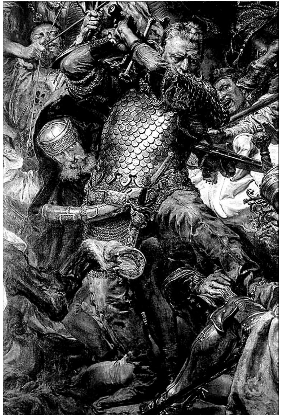
Чэх Ян Жыжка — валанцёр пад Грунвальдам, наёмнік на баку англічан у Стогадовай вайне, слаўны правадыр гусітаў. Такім яго намалюваў Ян Матэйка.

Агульнапрынятая версія — ваяры хацелі хутчэй вярнуцца дадому, бо якраз ішло жніво, трэба было парадкаваць ураджай. Аднак у выпад-