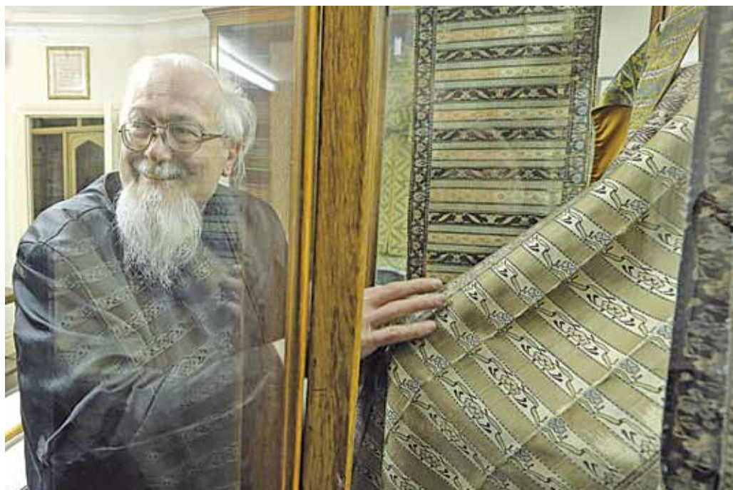
Унікальныя сліцкія паясы, купленыя на «большыным рынку».