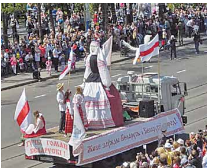
Карнавал у расійскім Іркуцку прайшоў пад бел-чырвона-белымі сцягамі, з якімі на свята выйшла беларуская дыяспара.