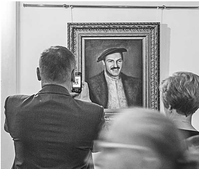
Берасцейцы здымалі Лукашэнку-Скарыну на мабільнікі.