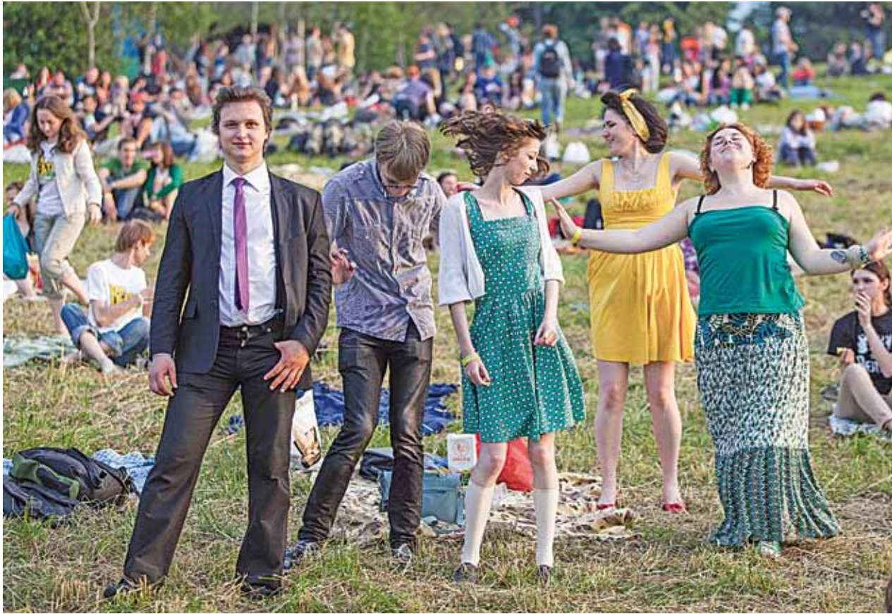
У першы дзень лета на хутары «Шаблі» (Валожынскі раён) прайшоў канцэрт пад адкрытым небам. «Бітлз-фэст» адбыўся без дажджу, затое з добрым настроем і музыкай.