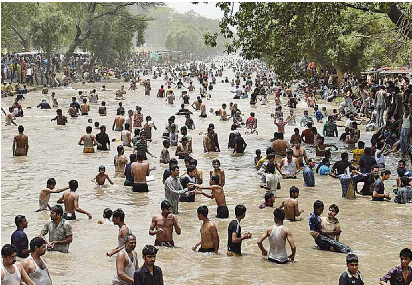
Спёка дакучае не толькі беларусам. Большасць жыхароў Лахора (другі па велічыні горад Пакістана) праводзіць першыя дні лета ў вадзе ці каля яе.