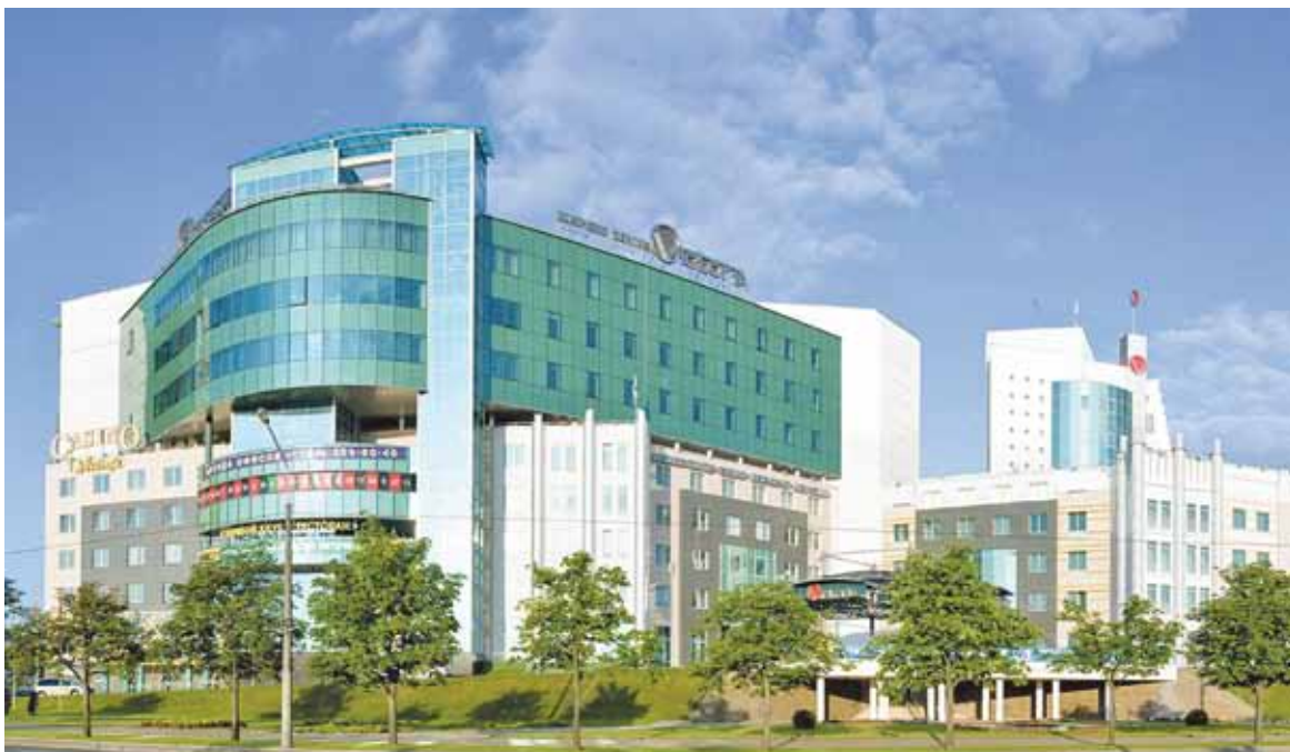
«Вікторыя» пачынала будавацца яшчэ пры Міхаілу Паўлаву. Неўзабаве па суседстве адкрыецца «Вікторыя-2».