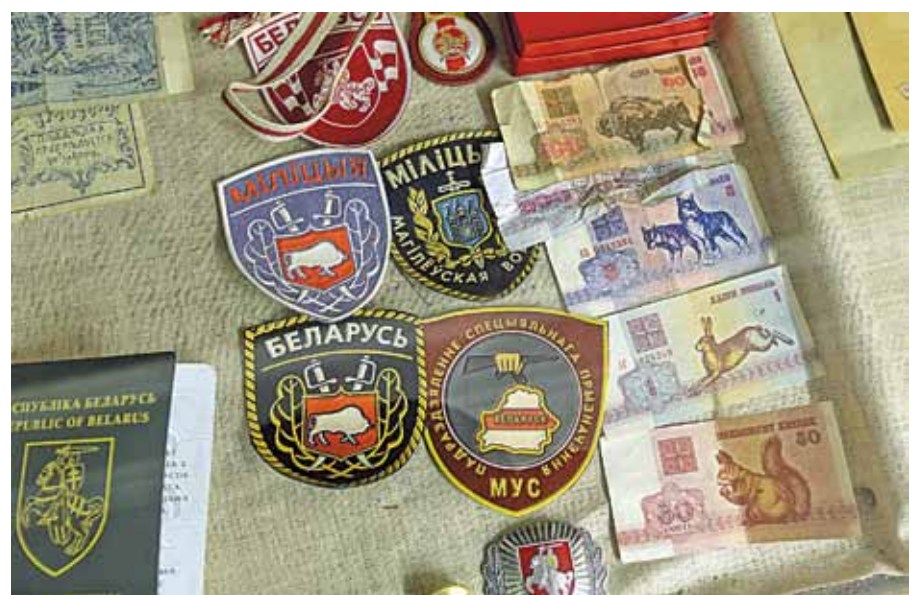
Экспанаты з першых гадоў незалежнасці.