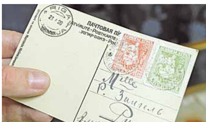
Паштовыя маркі БНР.