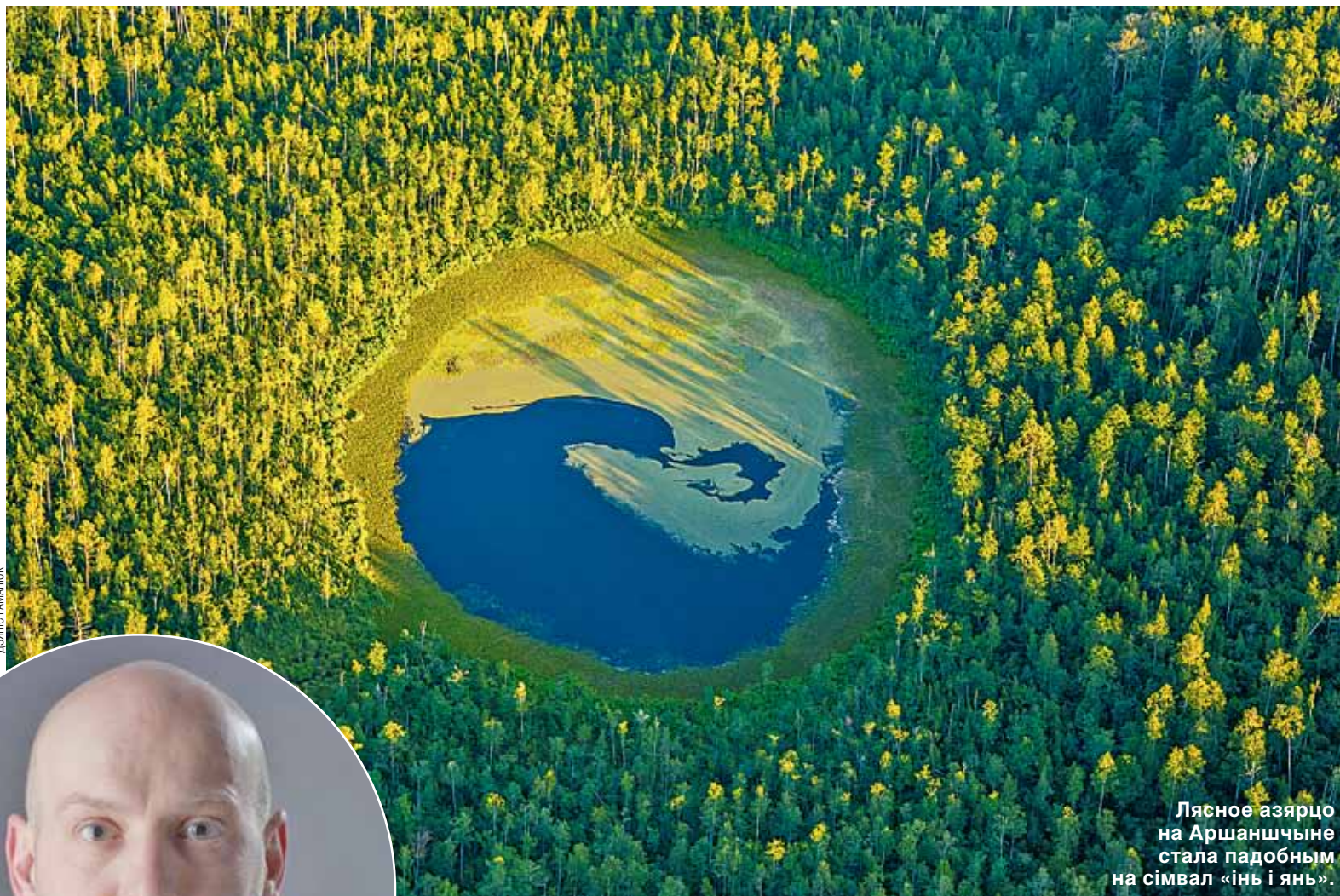
Лясное азёрца на Аршаншчыне стала падобным на сімвал «інь і янь».

Да 15 чэрвеня ў Нацыянальным мастацкім музеі (вул. Леніна, 20) працуе выстава Дзяніса Раманюка «Беларусь сінявокая». Зробленыя з зямлі, вады і нават з паветра 305 фотаздымкаў альбома, 25 з якіх экспануюцца на выставе, паказваюць вядомыя і схаваныя ад погляду чалавека азёры і рэкі.