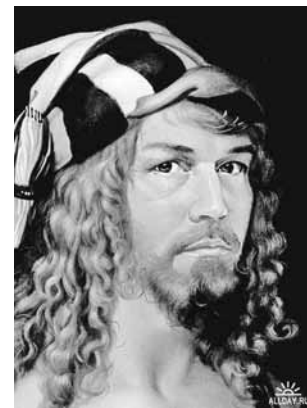
Сябе Сафронаў убачыў Альбрэхтам Дзюрэрам.