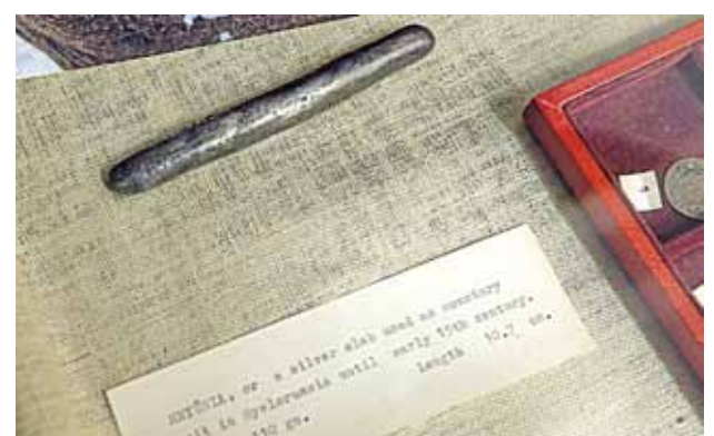
Срэбная грыўня: беларуская валюта XV ст.