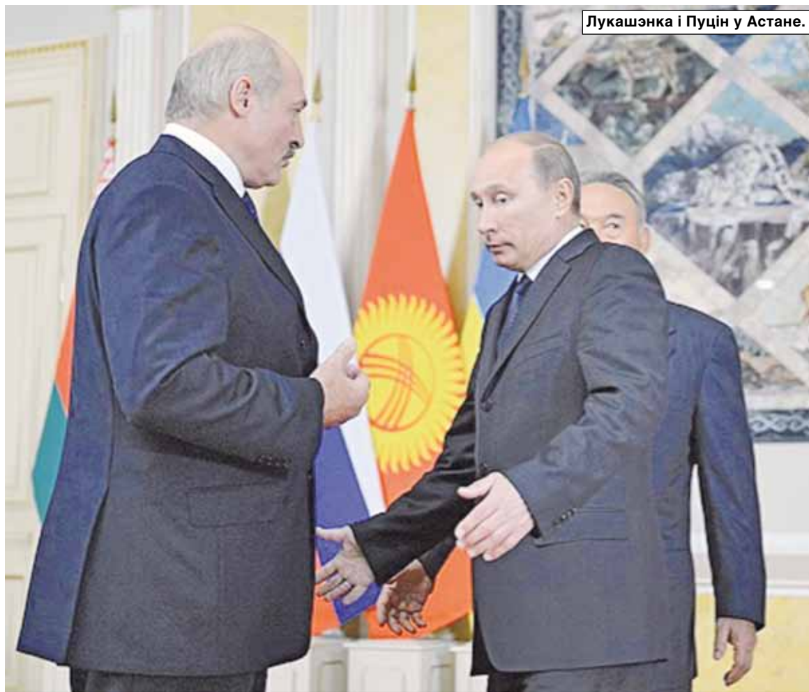
Лукашэнка і Пуцін у Астане.

Зараз Беларусь чакаюць няпростыя перамовы па ўступленні ў Сусветную гандлёвую арганізацыю. З другога боку, Лукашэнка не губляе надзеі атрымаць ад Расіі новыя субсідыі, гэтым разам ўзамен за панесены ад Мытнага саюза фінансавыя страты.