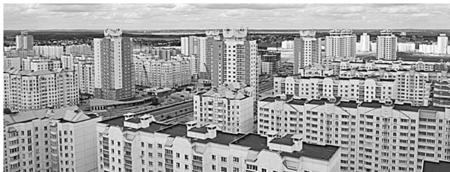
Пасля пагрозаў Лукашэнка колькасць здаваных кватэраў у Каменнай Горцы істотна скарацілася.