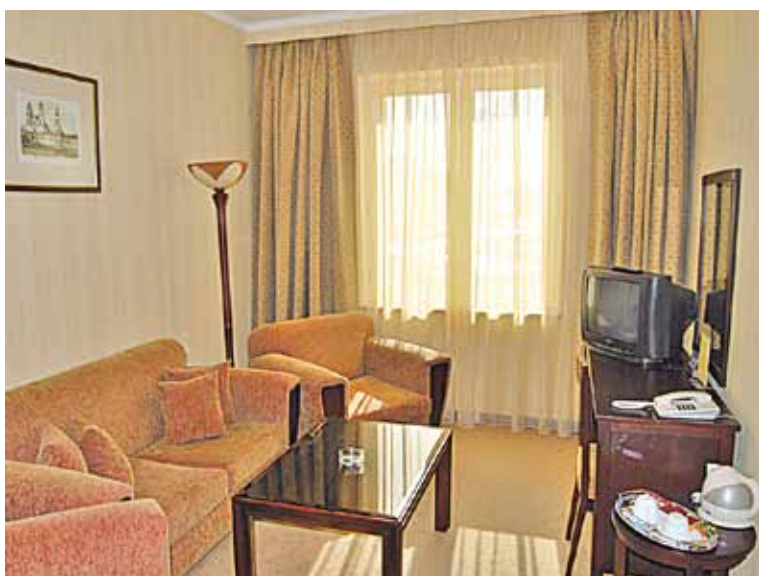
«Люкс» у гатэлі «Мінск» каштуе ад $300 за ноч, але выглядае па-савецку, скардзяцца турысты.