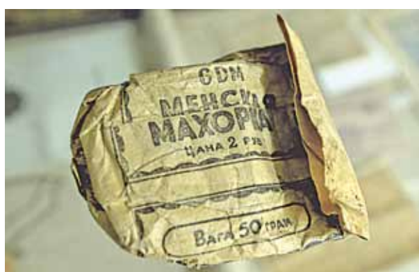
Пачак махоркі часоў Другой сусветнай.