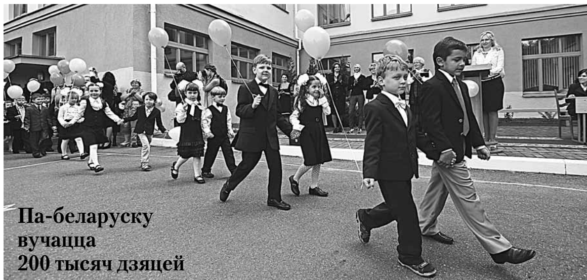
Па-беларуску вучацца 200 тысяч дзяцей

Гімназія №9 (Сядых, 10): паглыбленае вывучэнне англійскай мовы, факультатыўнае — польскай. Прапануе вывучэнне прадметаў музычнага цыкла. Т.: (017) 283-04-21, 281-38-04.