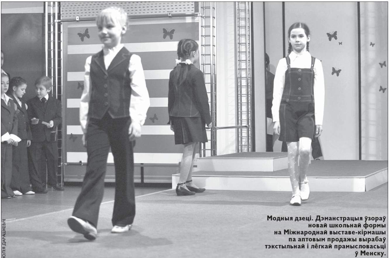
Модныя дзеці. Дэманстрацыя ўзораў новай школьнай формы на Міжнароднай выставе-кірмашы па аптывым продажы вырабаў тэкстыльнай і лёгкай прамысловасьці ў Менску.

Зьміцер Панкавец; паводле БелаПАН, «Звезда», радыё «Рацыя», БЕЛТА, Life.ru