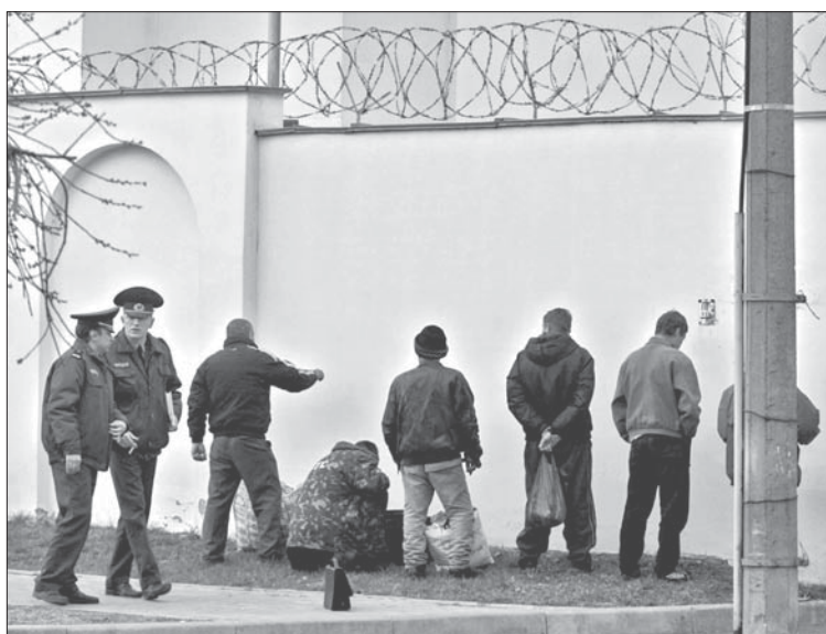
У спецпрыёмнік прывезьлі чарговую партыю адміністраўнікаў.