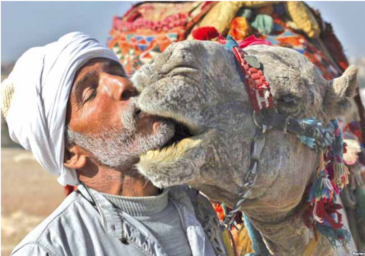
Мужчына са сваім вярблюдам ля піраміды Гізы (Егіпет) падчас чакання турыстаў.