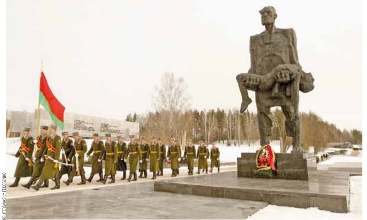
Мемарыяльны мітынг у Хатыні, 22 сакавіка.

на было паступіць на спецыяльнасць «Гісторыя. Англійская мова» усяго са 153 баламі (на бюджэт) і 130 — на платнае.