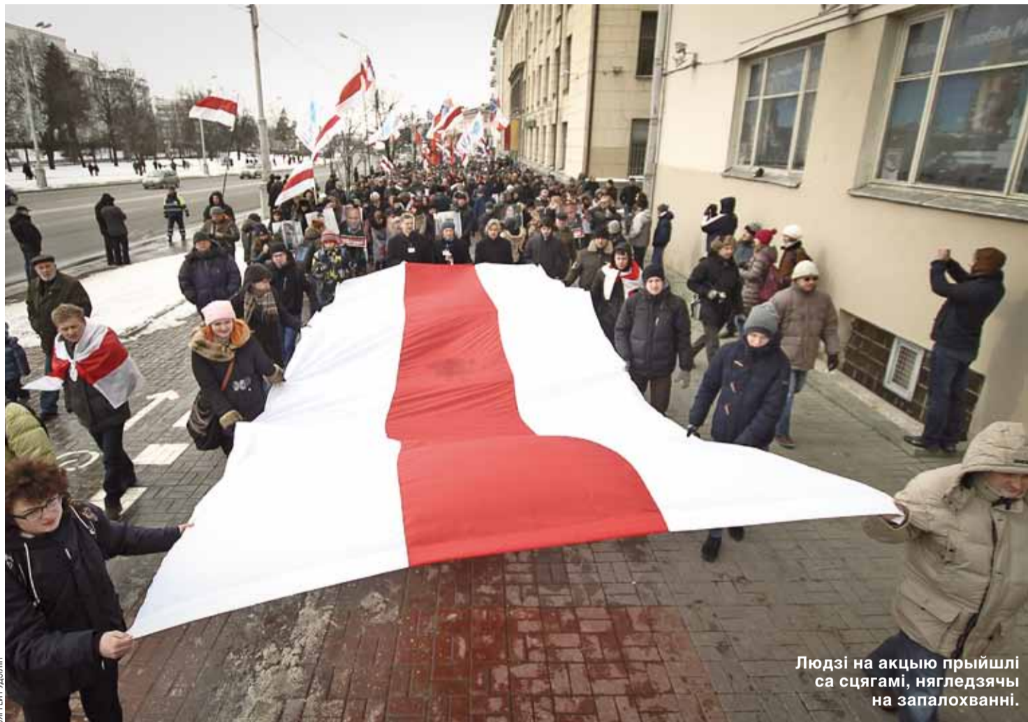
Людзі на акцыю прыйшлі са сцягамі, нягледзячы на запалохванні.