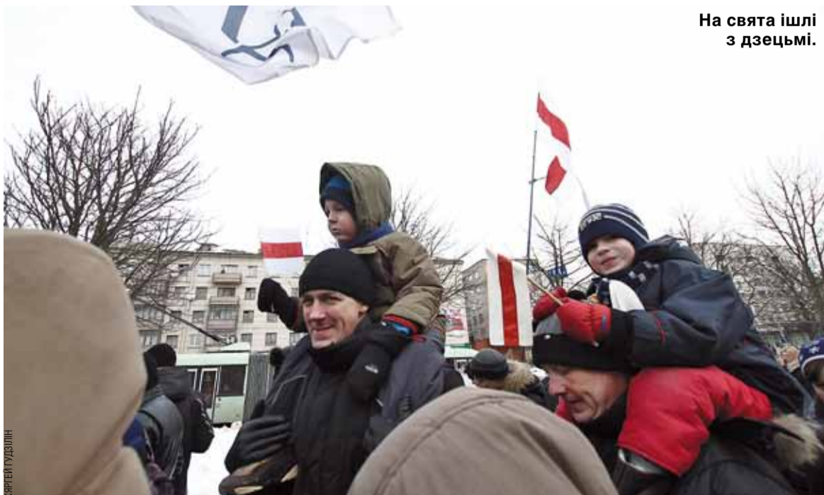
На свята ішлі з дзецьмі.