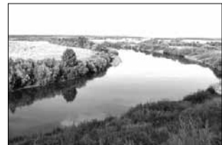
Нёман пачынаецца на паўднёвай Міншчыне і ўпадае ў Балтыйскае мора.