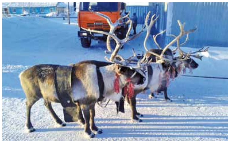
Паўночных аленьяў Павел часцей бачыць на патэльні, чым жыўцом.