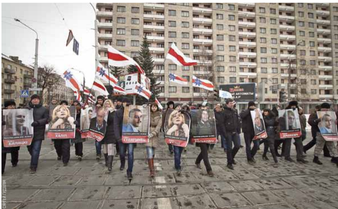
«Маладафронтаўцы» нагадалі пра палітвязняў.