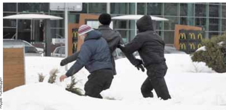
Пасля акцыі восем чалавек было затрымана.