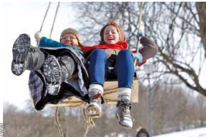
У вёсцы Вязынка (Маладзечанскі раён) прайшло традыцыйнае свята «Гуканне вясны». Яго зладзілі Студэнцкае этнаграфічнае таварыства і Дзяржаўны літаратурны музей Янкі Купалы.