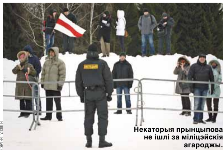
Некаторыя прынцыпова не ішлі за міліцэйскія агароджы.