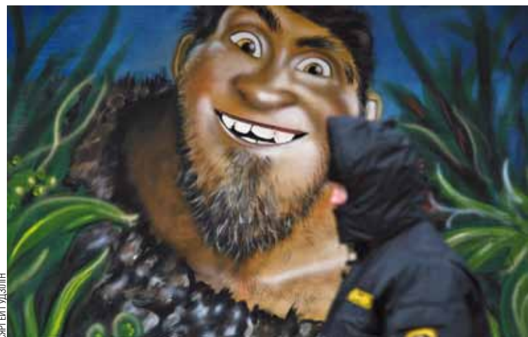
Сілавкі былі і замаскіраваныя, і незамаскіраваныя.