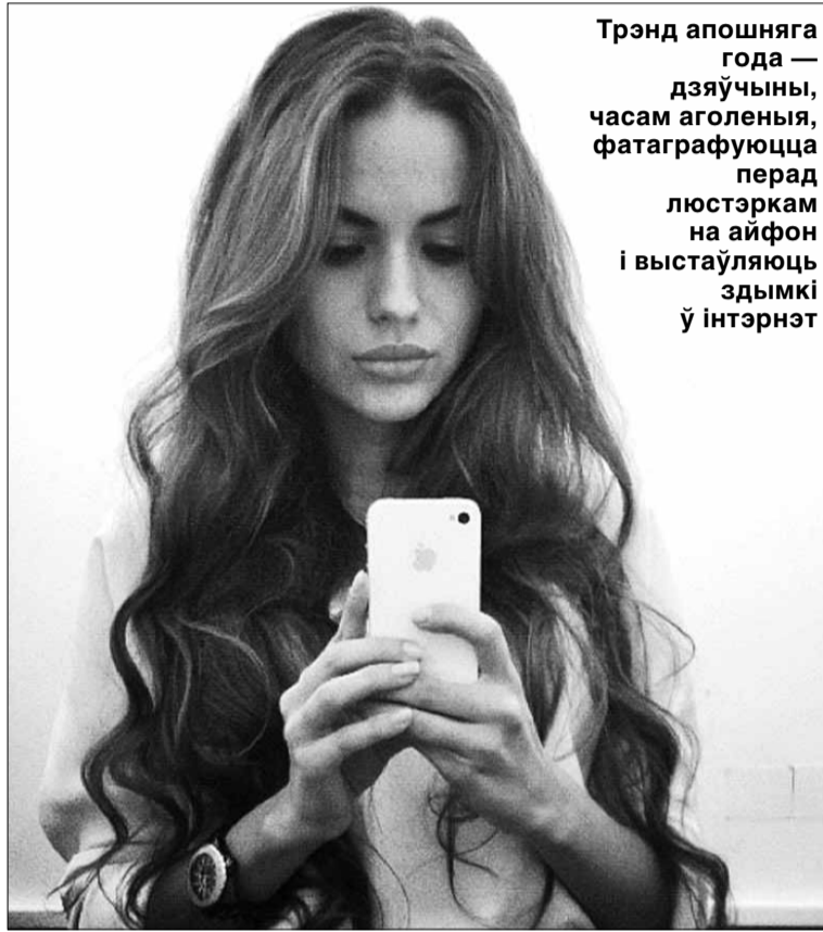
Трэнд апошняга года — дзяўчыны, часам аголеныя, фатаграфуюцца перад люстэркам на айфон і выстаўляюць здымкі ў інтэрнэт

«НН»: Колькі можа зарабіць чалавек, які гандлюе «яблыкавымі» прыладамі ў Мінску?