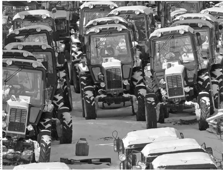
Трактараў «Беларус» хопіць на ўвесь свет.

Спіс леташніх паставак уравае: 11 кг гумовых шлангаў, 360 тон шын, 1 тона згушчонкі, 240 тон малочнай сыроваткі... Але пагоду робяць усё тая ж угнаенні. Іх летась было пастаўлена на $145 мільёнаў, як і пазалетась. У чым тады прынцыповы ўнёсак Міхаіла Мясніковіча, застаецца незразумелым.