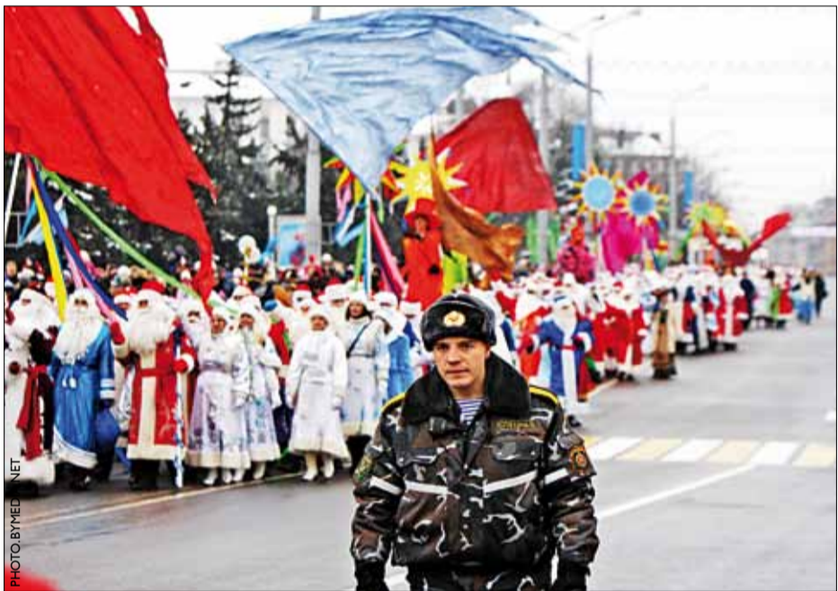
Інерцыя Плошчы: нават шэсце Дзядоў Марозаў і Снягурак, якое прайшло 25 снежня ў Мінску, ахоўваў спецназ. І перашкаджаў працаваць фатографам недзяржаўных СМІ і сусветных агенстваў.