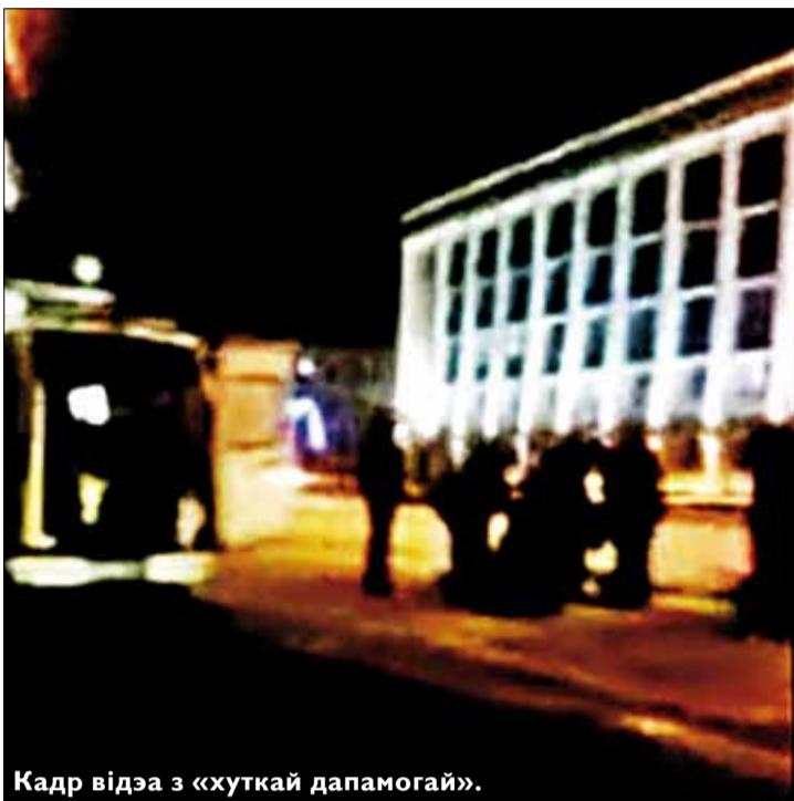
Кадр відэа з «хуткай дапамогай».