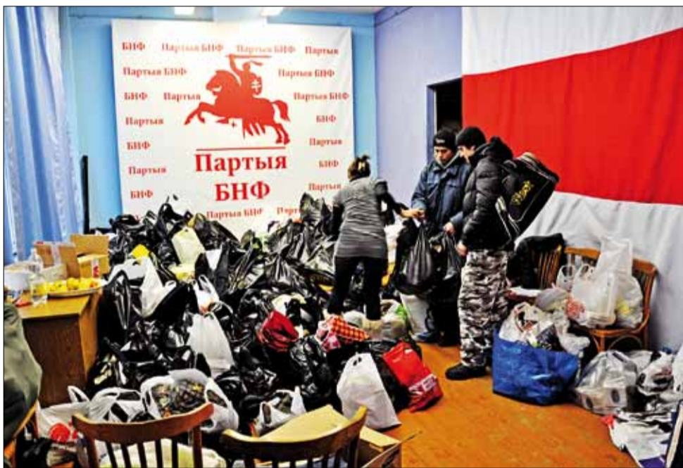
Збор рэчаў для арыштаваных спынілі, бо іх перабор. На фота: зала з рэчамі 23 снежня.

У дні, калі сотні людзей апынуліся за кратамі, мінская сядзіба БНФ ператварылася ў адзін са штабоў дапамогі рэпрэсаваным. Дзверы на Управу ад 20 снежня не паспявалі зачыняцца: штохвілінна ўваходзілі людзі здобрымі словамі, сваімі гісторыямі і матэрыяльнай дапамогай пацярапелым.