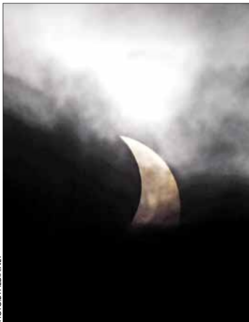
Гэта не Месяц. 4 студзеня ў Беларусі можна было назіраць рэдкую астранамічную з'яву — частковае сонечнае зацьменне.