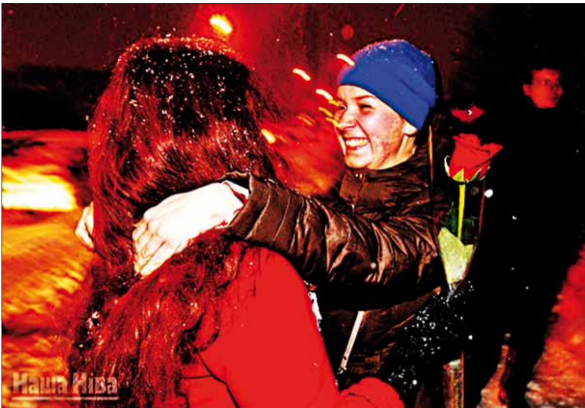
Акрэсціна: іх сустракаюць як герояў.

кам ператрусаў. Яны адбываліся на кватэрах і дамах дзясяткаў відных палітыкаў, грамадскіх дзеячаў, праваабаронцаў. Не абмінула гэта і рэдакцыі СМІ.