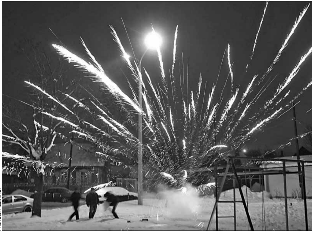
Няўдалы запуск петарды.

Такім чынам, цырк з'ехаў, а клоўнамі засталіся віцебскія глядачы, якім яшчэ трэба будзе вяртаць свае грошы.