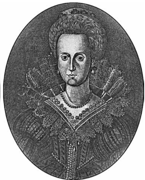
Януш Радзівіл і Лізавета Сафія Гагенцолерн. Гравюры Г. Ляйбовіча з альбома Icones familiae ducalis Radivilianae, 1757 г.

Выбар Ліхтэнберга не быў выпадковым. Мясцовасць знаходзілася ў самым цэнтры Імперыі, паміж каталіцкімі землямі (уладанні Габсбургаў ды баварскіх герцагаў) і пратэстанцкімі дзяржавамі (франконскія Гагенцолерны, уладанні Пфальцаў, саксонскія княствы і інш.), паблізу Багеміі. Януш меркаваў узяць чынны ўдзел у складаных палітычных камбінацыях паміж пратэстанцкімі князямі і імператарам Фердынандам II Габсбургам.