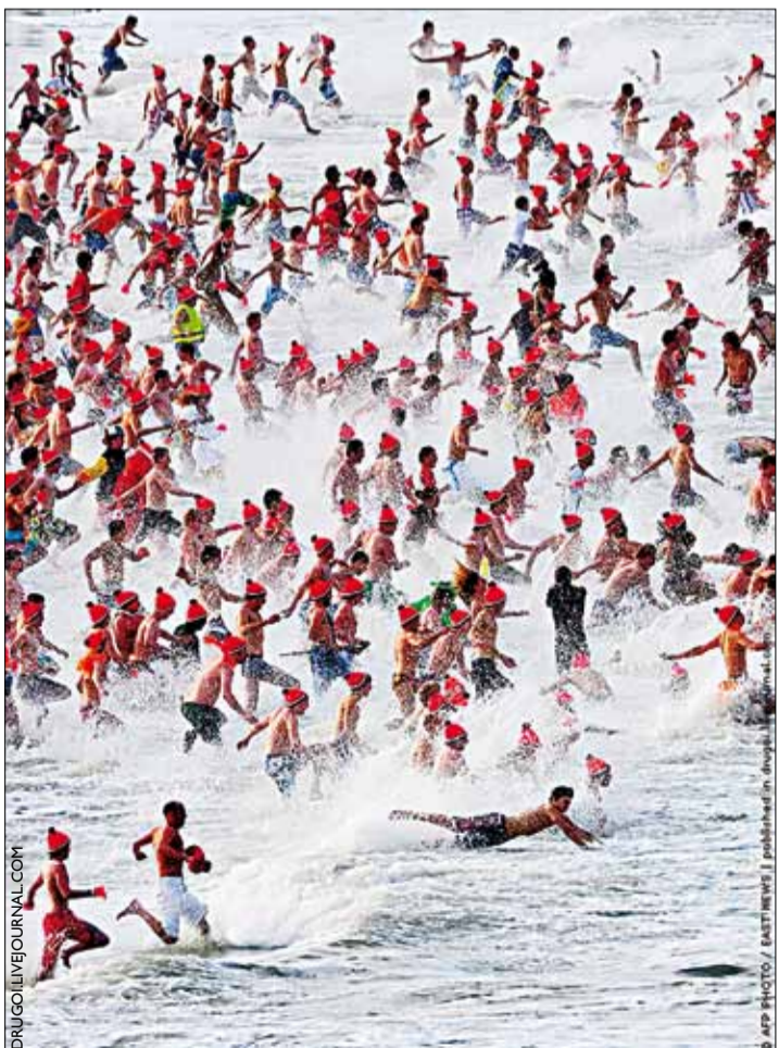
Гэта не Егіпет, а наваколле Гаагі. Мужныя галандцы сустрэлі новы 2011-ы заплывам у Паўночным моры.